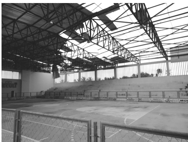
Figura 2: Estado de Conservação do Ginásio Municipal

Verificou-se no município estudado uma prevalência de estrutura física inexistente para práticas motoras orientadas nas escolas que ofertavam o Ensino Fundamental I (EFI). Apenas uma escola apresentava estrutura física adequada. A grande maioria das escolas era desprovida de espaços para realizar aulas de educação física (EF). Verificou-se também uma heterogeneidade na distribuição das unidades sociais de apoio. Cabe destacar que a pesquisa observacional permitiu constatar que os poucos espaços públicos existentes para práticas motoras, encontravam-se em situação de total abandono como ilustrado na Figura 2.