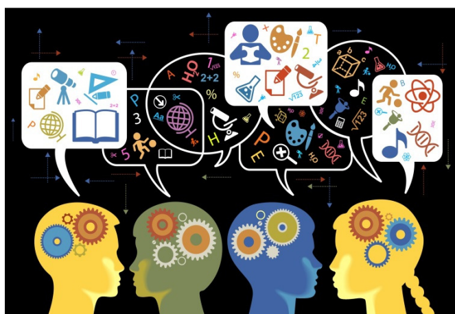
Figura 1 – ilustração do pensamento científico da, reproduzida pelo blog Futurism. Disponível em < https://futurism.com/free-science-the-best-free-courses-and-databases-on-the-internet/ >. Acessada em 04 mai. 2018.

Desde os primórdios da Ciência, o debate sobre a forma do desenvolvimento científico e de se pensar Ciência é intenso. Muito já foi feito a respeito para trazer uma compreensão mais clara de como isso se dá diante da realidade que, conforme Victor Von Stenger 1 , é um dos limites possíveis para a Ciência. Neste ensejo, há uma célebre frase do matemático John Von Neumann, que nos afirma que “As ciências não tentam explicar, elas nem sequer tentam interpretar, elas, principalmente, fazem modelos. Por modelo entende-se uma construção matemática que, com a adição de certas interpretações verbais, descreve fenômenos observados. A justificativa de tal construção matemática é unicamente e precisamente a que se espera que funcione” (John Von Neumann apud Stenger, 2007, prefácio, p. 9, tradução livre) 2 .