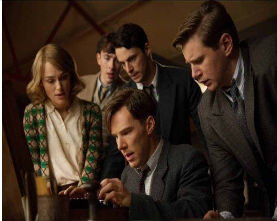
Figura 1 – Reprodução da cena do filme "The Imitation Game" ("O Jogo da Imitação"), de Graham Moore e Morten Tyldum, onde um grupo de cientistas e engenheiros, liderados pelo matemático Alan Mathison Turing, no projeto Bletchley Park, estão trabalhando na decodificação da máquina alemã de criptografia "Enigma".

eram considerados paradigmas científicos que, após serem quebrados, puderam desenvolver ainda mais a Ciência como um todo.