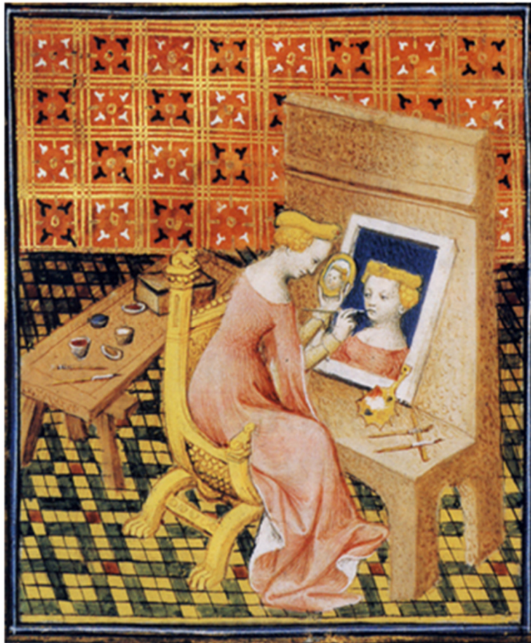
Figura 3: Marcia pintando autorretrato. Imagem do Século XV