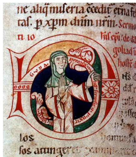
Figura 8: Detalhe da homilia pintada por Guda

Fonte: Biblioteca da Universidade de Frankfurt. Manuscrito Barth42 folio 110v. Imagem em domínio público.