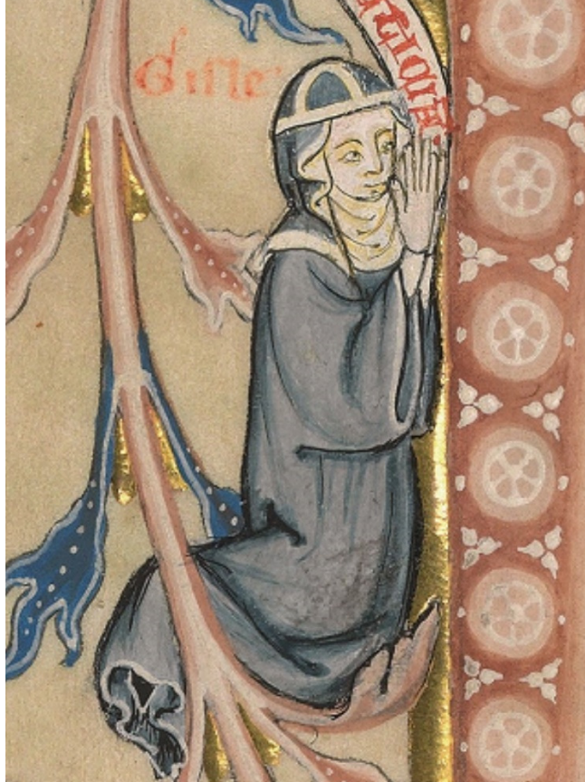
Figura 12: Gisela orando

Fonte: Commentary of Hoheburg folio 323r. Imagem em domínio público.