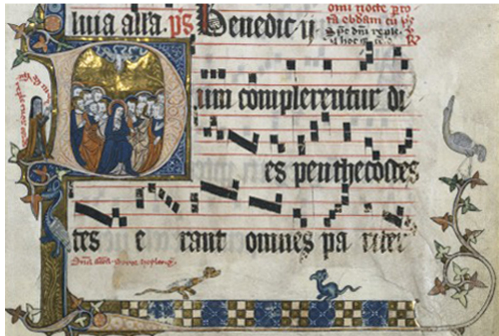
Figura 13: Detalhe de uma antífona do Convento Franciscano de Santa Klara, Colônia, Alemanha