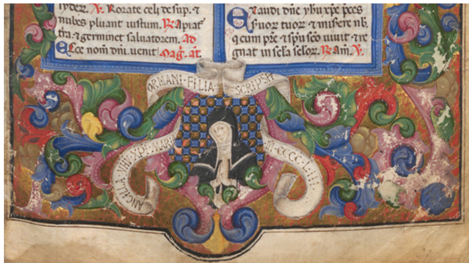
Figura 17: Maria Ormani

Fonte: Codice Vienna folio 89r. Osterreichische_Nationalbibliothek. Imagem em domínio público.