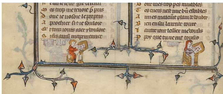
Figura 15: Casal Montbaston trabalhando juntos