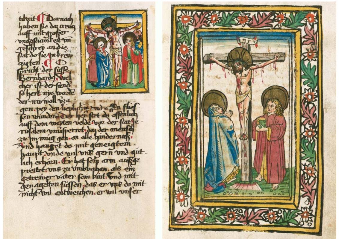
Figura 18: Crucificação