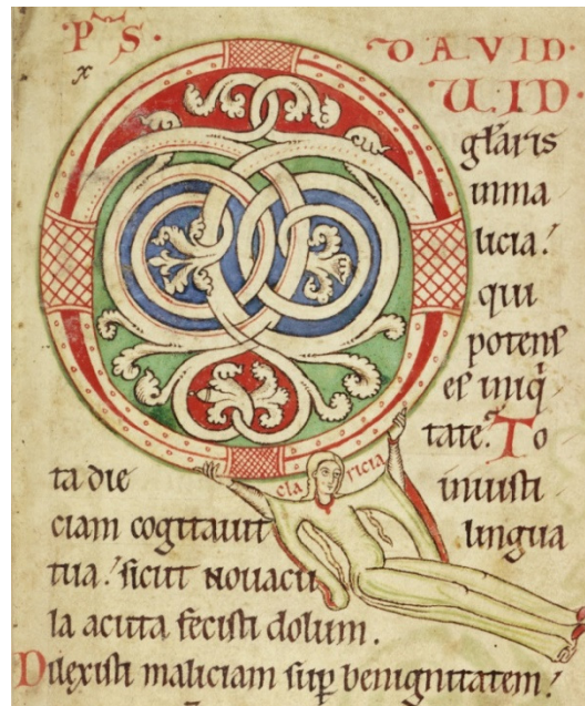
Figura 11: Clarícia, Salmo 52