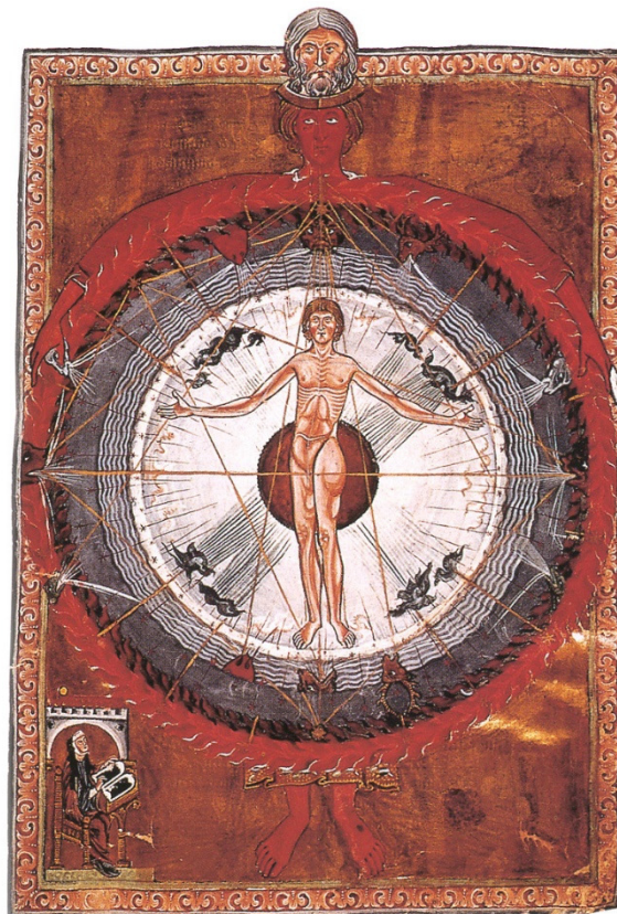
Figura 9: O Homem Universal.

Fonte: Liber Divinorum Operum. Imagem em domínio público.