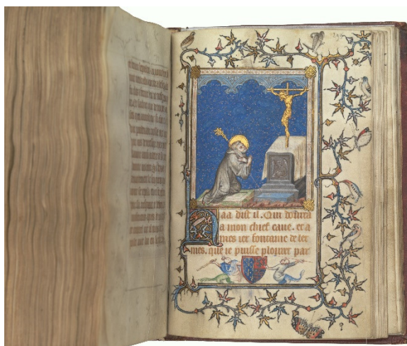
Figura 16: Oração