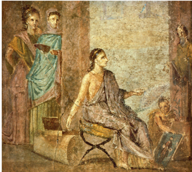
Figura 5: Mulher pintando ao lado de uma estátua de Priapo