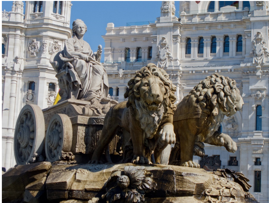
Fonte: Francisco Gutiérrez Arribas (Escultor) Foto: Carlos Delgado – Imagem em domínio público

Minha pesquisa sobre a mulher nas artes plásticas se restringe à cultura ocidental. Entretanto, é possível abranger superficialmente o Egito Antigo. Embora eu não tenha encontrado relatos ou imagens sobre a existência de pintoras ou escultoras nessa cultura, me atrevo a pensar que elas também existiram, pois a mulher tinha mais liberdade do que nas demais civilizações da época. Muitos relevos, pinturas e manuscritos mostram maridos e esposas exercendo atividades em conjunto. Os documentos comprovam que ela podia gerenciar os negócios da família, se divorciar e exercer diversas atividades profissionais, religiosas e artísticas, entre elas a dança e a música (cantando ou tocando instrumentos musicais) 5 .