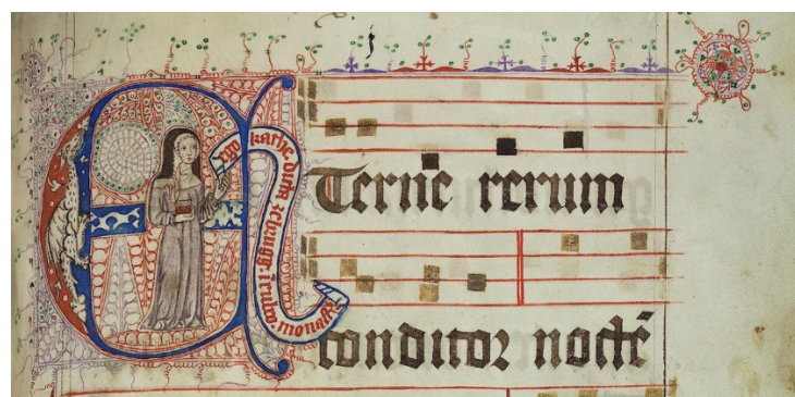
Figura 14: Liber hymnorum — Rothenmünster, 1366, folio: 1r

Fonte: Universitätsbibliothek Heidelberg, Cod. Sal. IX, 66. Imagem em domínio público.