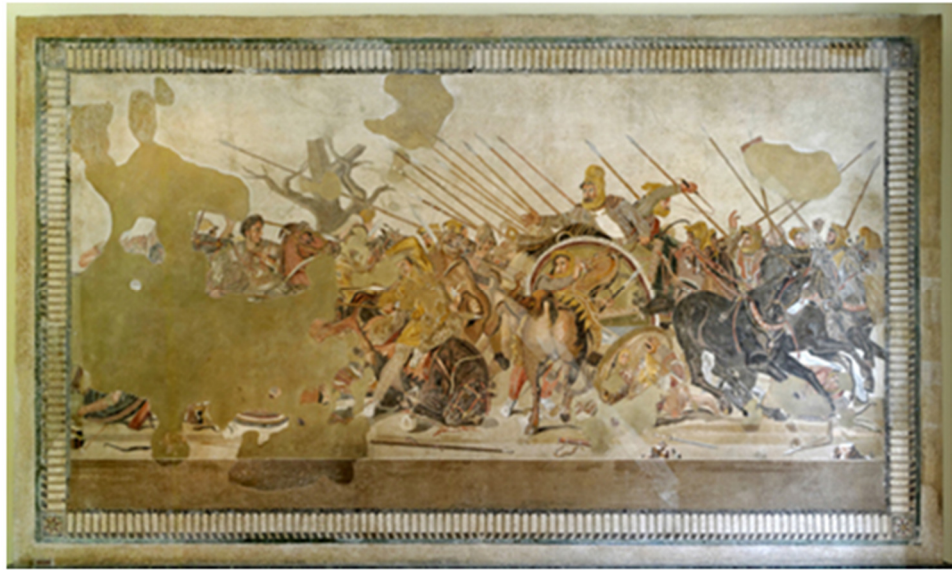
Figura 4: Mosaico de Alexandre durante a batalha de Issos

Fonte: Museu Arqueológico Nacional de Nápoles Imagem em domínio público