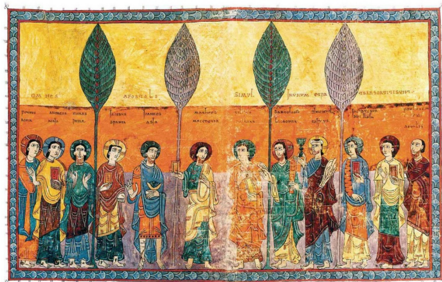
Figura 7: Beato de Gerona: Os Apóstolos

Fonte: Códice de Gerona. Folios 052v-53r. Imagem em domínio público.