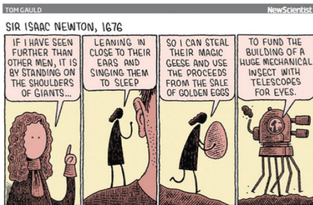
Figura 2: Cartoon publicado pela New Scientist no Facebook e segundo post mais curtido durante o período de arquivamento

Ademais do humor, ressalta-se a recorrência do uso de um referente cultural próximo. Nesse caso, de um personagem importante do campo científico britânico, mais especificamente da Inglaterra, considerando a nacionalidade da página, do cientista e do leitor presumido da página.