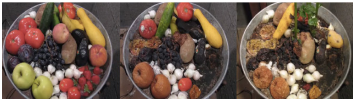
Figura 1: Vídeo do Galileu no Facebook , postagem mais popular de nossos dados coletados

popular postado pela New Scientist (min._NS = 22), o post mais curtido pelos usuários teve 473,09 vezes mais curtidas do que o post menos gostado (max._G / min._NS = 473,09).