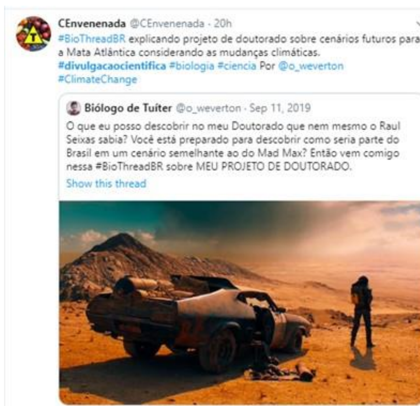
Figura 7. Tecnodiscurso relatado integral - Tuíte em análise