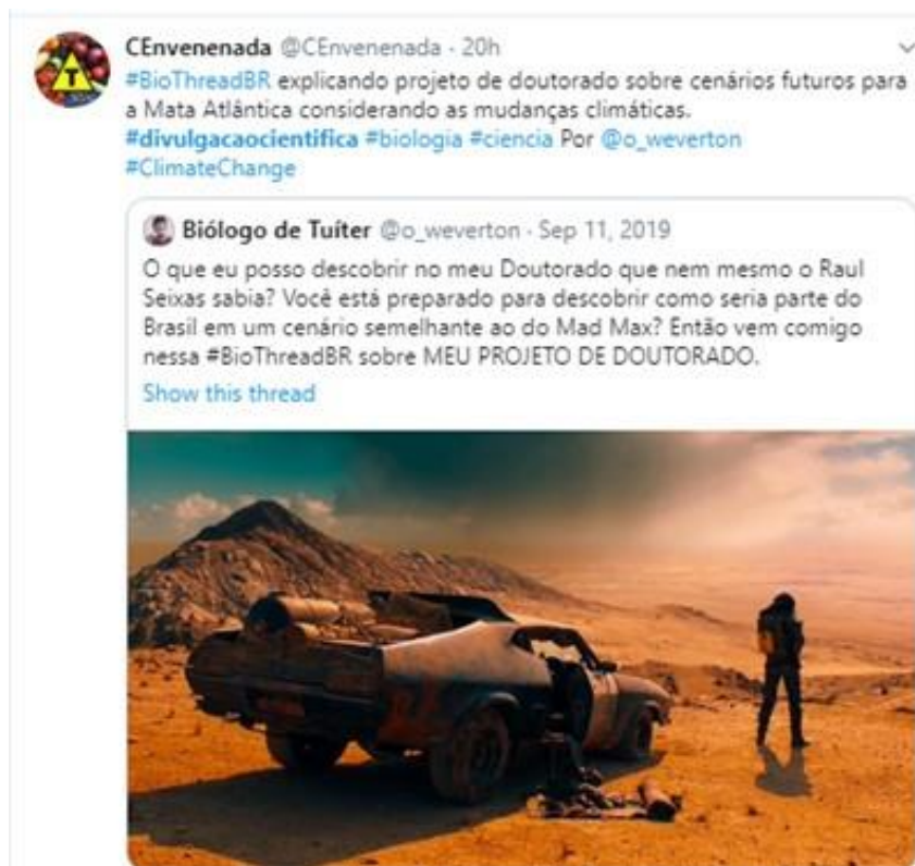
Figura 5. Tuíte em análise