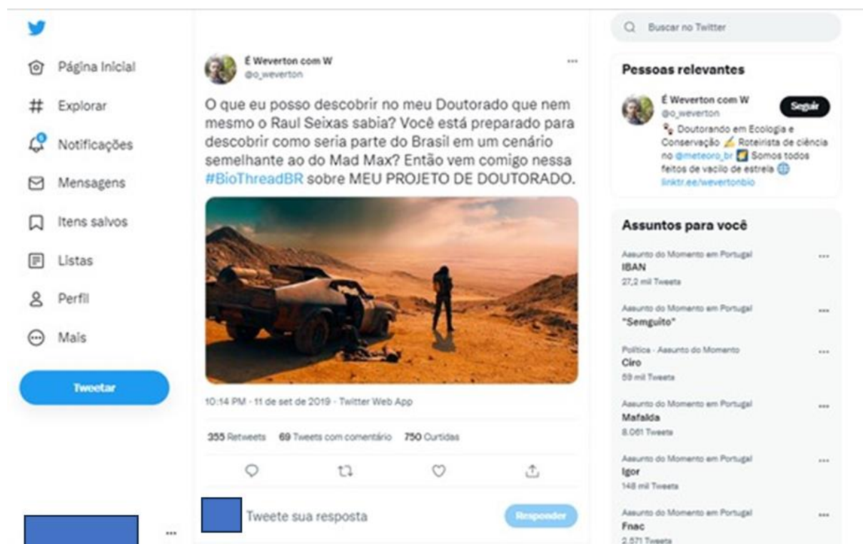
Figura 6. Enunciador digital 2 do tuíte em análise (Ed2-1)