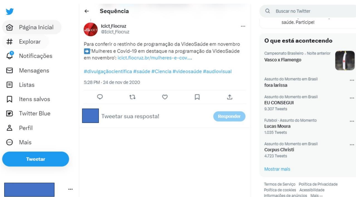
Figura 2. Exemplo de TRRes