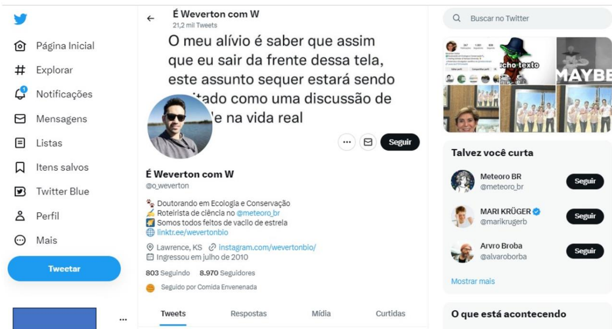
Figura 4. Biografia do locutor @O_weverton