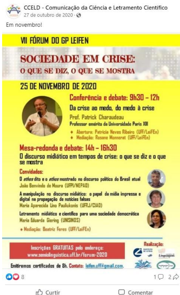
Figura 3. Exemplo de TRRep

Na figura 3, apresentamos um exemplo de TRRep.