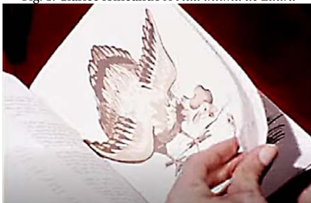
Fig. 1. Clarice folheando A vida íntima de Laura