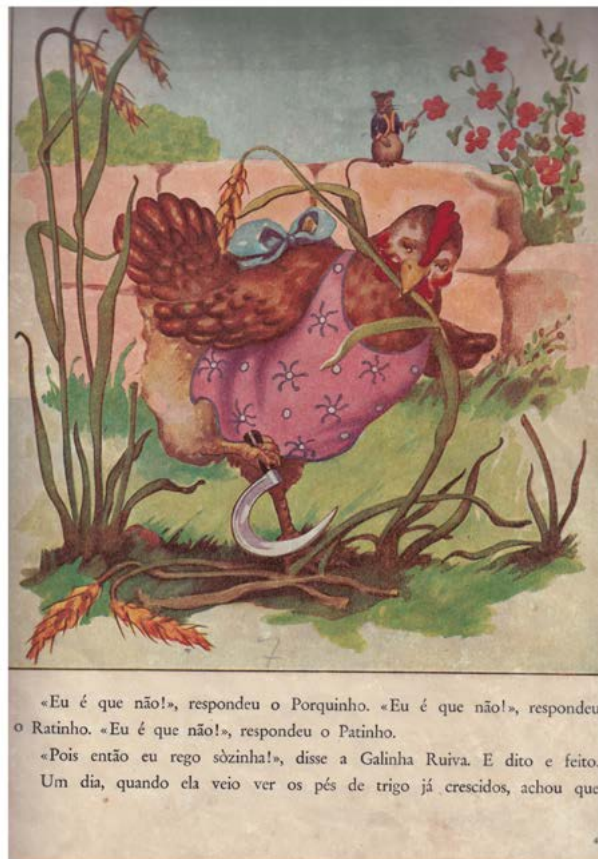
Fig.4. Teor socialista de A galinha ruiva

Quando Clarice me propôs isso, para mim foi sopa no mel. Sabia tudo sobre galinha. Confesso que não conhecia a fundo Clarice na época para dar qualquer tipo de conotação de Clarice para esses desenhos, mas posso dizer isso agora, sei da íidiche mama , da gravidez, a simbologia grandiosa do ovo para Clarice, mas eu não sabia nada disso na época.