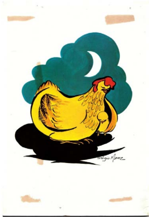
Fig.3- Contracapa de A vida íntima de Laura , de Clarice Lispector

Fonte: LISPECTOR, Clarice. A vida íntima de Laura . Rio de Janeiro: José Olympio, 1974.