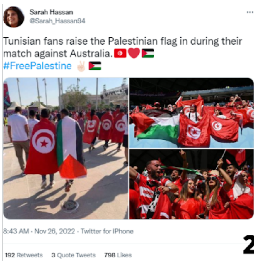
Fig. 4. Fotografias com registros de torcedores com bandeiras palestinas.

A partir disso, o presente estudo conseguiu identificar a tentativa de associação da questão palestina a grandes eventos midiáticos como parte das estratégias de conquistar atenção internacional. A Copa do Mundo da FIFA realizada no Qatar, dado a seu ineditismo, foi uma grande oportunidade para os ativistas disputarem a atenção midiática, objetivando alcançar efeitos políticos centrados no conflito palestino-israelense. Compreendemos que, em decorrência da maior facilidade de Israel em apresentar seus enquadramentos sobre o conflito, em diversos casos apagando a experiência e as demandas palestinas, os palestinos utilizam eventos midiáticos para competir pela atenção internacional.