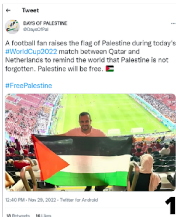
Fig. 2. Fotografia de torcedor com bandeira palestina.

O posicionamento do time do Marrocos, geográfica e ideologicamente próximo à Palestina, incentivou demonstrações dessa natureza. Apesar da presença de outros países de maioria muçulmana ou do Oriente Médio e Norte da África (MENA) na competição, o sucesso do Marrocos na Copa e massivas demonstrações de apoio à Palestina foram elementos fundamentais para a associação entre os países nas comunicações analisadas. Além disso, a primeira realização da Copa em um país árabe também possibilitou que ativistas da causa palestina da região e palestinos expusessem a bandeira do país ao longo do evento em decorrência das facilidades logísticas.