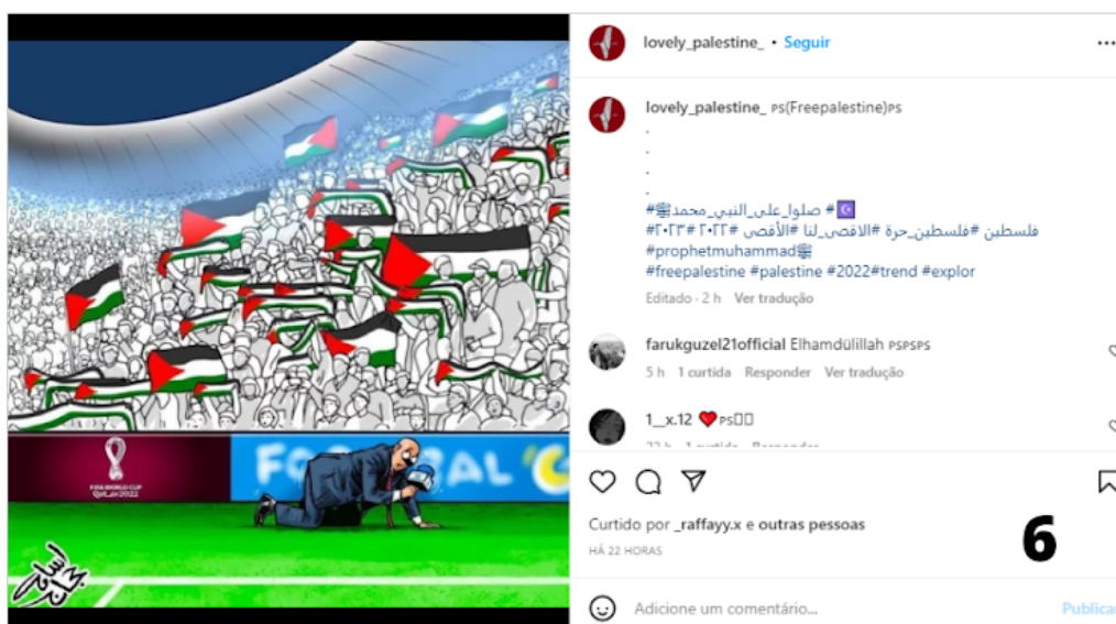
Fig. 1. Comunicação sobre as demonstrações de apoio à causa palestina.

O corpus foi composto, descartando as redundâncias, por 7 imagens compartilhadas – de um universo total de 19 imagens recolhidas – no referido período, associadas às hashtags #palestine e #freepalestine . O principal elemento visual observado foi a bandeira palestina, presente em diversos casos, associada com demonstrações de apoio por parte dos jogadores do Marrocos e pela torcida em geral.