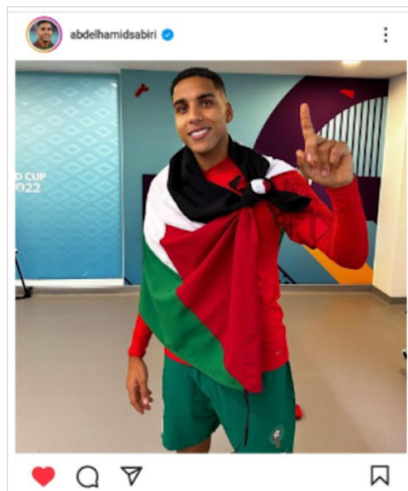
Fig. 6. Fotografia de atleta do Marrocos com bandeira palestina.

Por meio dessas comunicações celebram-se demonstrações de apoio enquanto possibilidade de conquista de legitimidade a partir da associação a grandes estrelas do futebol mundial. As demonstrações de apoio de jogadores do Marrocos à causa palestina por meio de fotos postadas nas redes sociais usando a bandeira do país (Figuras 5 e 6), desempenham um papel vital nos esforços de amplificação da conscientização global sobre a luta palestina. Figuras públicas e atletas influentes usam sua plataforma para expressar solidariedade, e