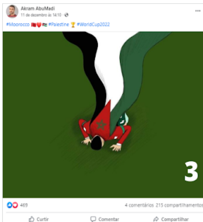
Fig. 7. desenho com associação entre a causa palestina, o Islã e futebol.

A representação de eventos de rechaço a jornalistas israelenses (Figura 1) comemora a postura de apoiadores, apesar de seu de serem questionadas em redes de notícias internacionais (Nereim; Kingsley, 2022). Além disso, as hashtags são utilizadas para expandir o público potencial dessas comunicações: disputa-se atenção nas redes digitais, significando essas demonstrações como parte do ativismo civil pró-palestina.