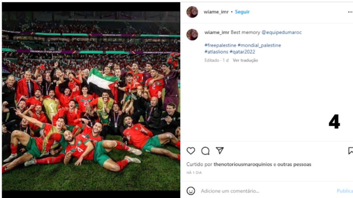
Fig. 5. jogadores do Marrocos com bandeiras palestinas.