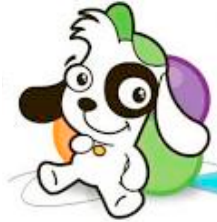
FIGURA 1 – Canales infantiles: imagen del Discovery Kids

La idea de segmentación llevó a la producción de programas segmentados y luego a la creación de los canales para párvulos a mitad de los '90 (Discovery Kids, Cbeebies, Nick Jr., Disney Jr.) (Fig. 1). Ya no se debería producir TV infantil en general sino segmentada hacia la diversidad de audiencias infantiles con necesidades y capacidades diferenciadas.