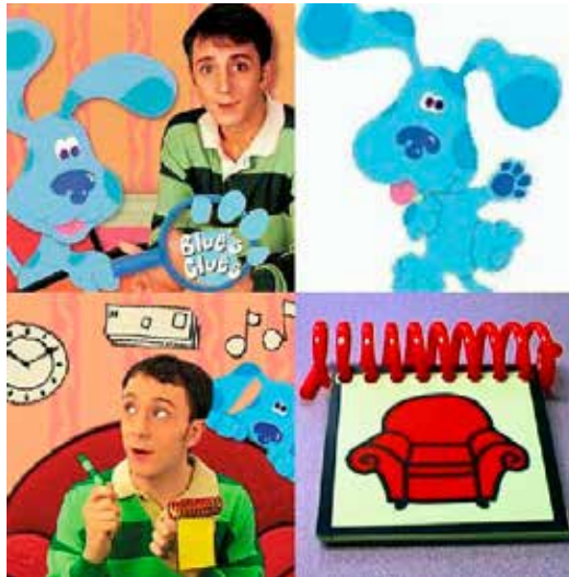
FIGURA 2 – Imágenes del programa Las Pistas de Blue

Sésamo (1969) fue realizado inicialmente bajo las teorías conductistas de la época: estimular al niño desde la pantalla para mantenerlo atento al espectáculo. Veinticinco años más tarde aparece el programa Las Pistas de Blue (1996) (Fig. 2) realizado bajo la teoría que el niño atiende a un programa porque el niño es invitado desde el interior del programa a ejercitar sus intereses internos activos : agrado en jugar, imaginar, descubrir en la pantalla, resolver un desafío, lograr una meta, pensar, asociar pistas, inferir.