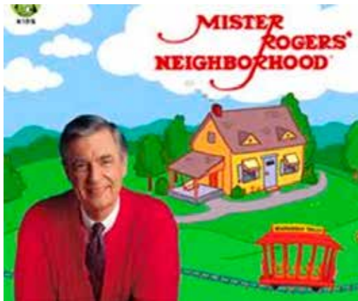
FIGURA 5 – Imagen de Mister Rogers' Neighborhood

La historia permite construir una narración con el esquema dramático donde el Sujeto protagonista busca alcanzar alguna meta o un logro (Objeto) en el tiempo narrativo. Es el esquema: