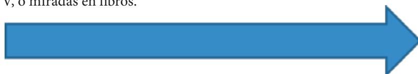
FIGURA 4 – Formato de unidad narrativa amplia

La psicología cognitiva ha descubierto que los niños desde edad temprana construyen scripts con secuencias narrativas para comprender sus propias actividades. Se valoriza, entonces, la realización televisiva con el formato de historia, en el cual la audiencia infantil debe construir activamente la significación desde una unidad narrativa más amplia temporalmente y con una secuencia más compleja. Pero, con su imaginación, el niño fantasea y adorna las historias de la TV, o miradas en libros.