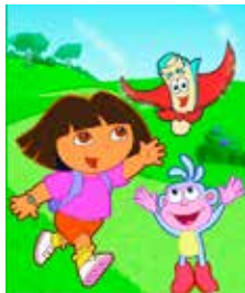
FIGURA 6 – Imagen del programa Dora la Exploradora

La interacción con la audiencia es un recurso propio de la TV en vivo; en estas series grabadas se ha innovado trabajando la interacción desde el interior de la ficción. El cine no trabaja la interacción con la audiencia y se mantiene como espectáculo para la audiencia.