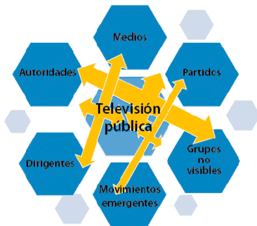
DIAGRAMA 3. INFLUENCIA INTERACCIONAL DE UNA SEÑAL SEGMENTADA EN INFORMACIÓN

El diagrama 3 grafica la interacción esperada en una señal segmentada y plural.