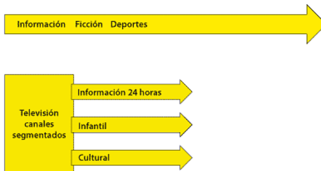
DIAGRAMA 2. MODELO GENERALISTA Y MODELO SEGMENTADO EN TV

3. En la actualidad se hace una diferencia entre Gobierno y Estado. Gobierno es la función ejecutiva entre los otros poderes del Estado, pero el Estado comprende además el poder legislativo y el poder judicial. Lo público es más amplio ya que incluye a la sociedad civil, tercer sector , organizaciones intermedias, ciudadanía organizada en grupos de diversos intereses sociales, ONGs. El control gubernamental sobre una estación televisiva no-autónoma del Gobierno se hace a través de la designación de sus autoridades y ejecutivos superiores , los cuales son removidos por el Gobierno sucesor, también por el control económico de los ingresos para la operación, y por el control según normas administrativas de la burocracia estatal. Una estación pública autónoma del Gobierno define su autonomía en la designación de su cuerpo directivo, en su presupuesto económico, y en su capacidad de gestión administrativa. La designación del cuerpo directivo en una TV autónoma se hace de modo que el ejecutivo y el legislativo estén representados y en una proporción donde la minoría tenga un poder real; se busca la negociación y el acuerdo para estar al servicio de la ciudadanía y no de la mayoría política de turno. Hay también diseños que buscan la consulta a la sociedad civil, que debe combinarse con la buena gestión y administración empresarial; esto se relaciona con una buena gestión administrativa. La autonomía financiera es más difícil de resolver: la asignación presupuestaria