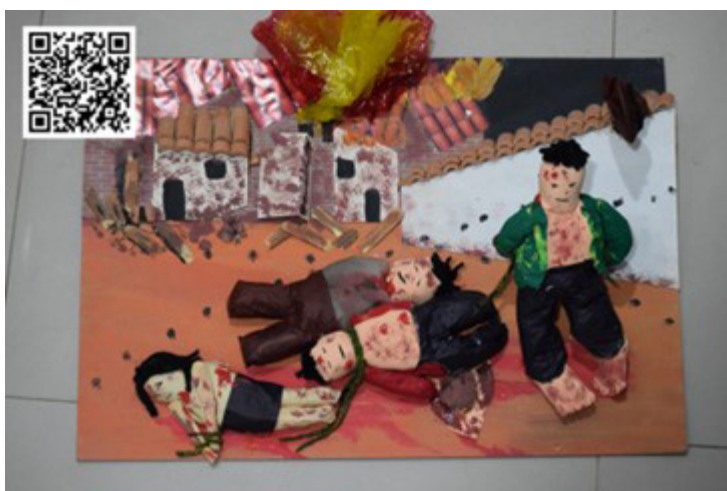
Figura 1: Adaptación de la pintura de “Masacre en Colombia” de Fernando Botero Nota. elaboración propia de los autores.

“Yo sobreviví” fue el génesis del proyecto, se trató de un primer recorrido que recogió 30 relatos de sobrevivientes a masacres perpetradas por grupos al margen de la ley en Colombia, todos ellos sistematizados por Rutas del Conflicto (2021), una experiencia de periodismo de datos que por su fiabilidad y calidad informativa fue considerada como la fuente principal para que los estudiantes hicieran su propia resignificación narrativa de varias historias en donde testigos de masacres relatan los hechos y los impactos emocionales que les generaron. Allí el uso de los lienzos fue el camino para jugar con lo simbólico, donde alegorías a pinturas de amplio reconocimiento serían resignificadas, e incluso alteradas por los creadores (ver Figura 1), esto con el fin de crear escenarios oníricos para relatar dimensiones emocionales en primera persona como si ellos hubiesen sido los protagonistas originales de la historia (Alvarado Vivas, 2018).