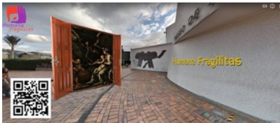
Figura 3: Inicio del recorrido 360° de Humana Fragilitas 2021

La segunda fase estuvo enmarcada por las particularidades de la pandemia por la COVID-19, de allí que se denominara “Humana Fragilitas” (Fragilidades Humanas). De allí surgieron dos recorridos en fotografía esférica que tuvieron como centro compartir relatos que ahondaran en varias de las problemáticas agudizadas por el confinamiento: afectaciones emocionales, casos de violencia de género, además de los impactos a la juventud y la niñez. Las temáticas emergieron de manera orgánica y fueron propuestas por los estudiantes que como creadores se sintieron en la responsabilidad de reflexionar estos escenarios narrativos como una posibilidad para hacer catarsis frente a asuntos que estaban permeando sus contextos inmediatos. Si bien la imposibilidad de salir con plena libertad y tranquilidad por las restricciones constituyó al inicio un aparente obstáculo en términos de producción, significó también una posibilidad para construir una serie de mashups y de mixturas entre producción propia y de terceros (ver Figura 3). Como particularidad adicional, aquí la RV fungió como un posibilitador para conectar relatos producidos geográficamente distantes pero que tenían objetivos comunes. También, fue una treintena de relatos que fueron más experimentales, y que quisieron llevar a los usuarios a escenarios de introspección, para también intentar transportarlos a los complejos cuadros emocionales que experimentaron varios de los personajes protagonistas de las historias.