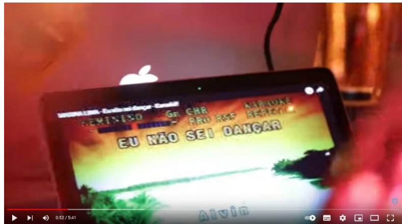
Figura 3: Letra da música “Não sei dançar” de Marina Lima