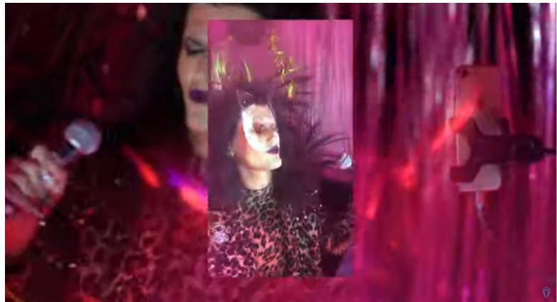
Figura 2: Título: Dois ângulos de Catto sobrepostos

A explosão de sinceridade na conservadora cidade, como coloca Catto, e em espaço oficial, como a Casa de Cultura Mario Quintana, é fruto do conhecimento construído durante a pandemia. Cantoras como Máisa, Gal Costa, Amy Winnehouse e cantores como Ney Matogrosso e Lou Reed desfilam na segura voz de Catto, além de edições como o especial Cynema, Marisa Monte, especial Sapatão e Marina Lima, alguns especiais se voltaram a discos específicos. Os especiais contam com produção melhor cuidada, sem a preocupação de se esconder a estrutura de produção, aliás, estrutura doméstica. A pós-produção melhorou, a captação foi realizada com duas câmeras, de celular.