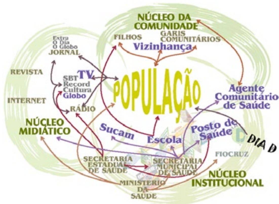
Figura 4 – Fontes e fluxos de comunicação sobre a dengue para a população do Complexo de Manguinhos (Rio de Janeiro, RJ)

No âmbito da população, obtivemos um mapa das suas principais fontes e fluxos de comunicação sobre dengue (figura 4), às quais acrescentamos inferências a partir da análise dos núcleos midiático e institucional. Em azul, podemos ver as comunidades discursivas mais fortes, citadas com mais insistência pelos entrevistados como fontes relevantes: encontramos a televisão, a vizinhança, o posto de saúde, os agentes comunitários de saúde, a Sucam (Superintendência de Campanhas da Saúde Pública) 6 e a escola. Podemos também apreciar um fluxo marcante de informação do núcleo institucional para o núcleo midiático.