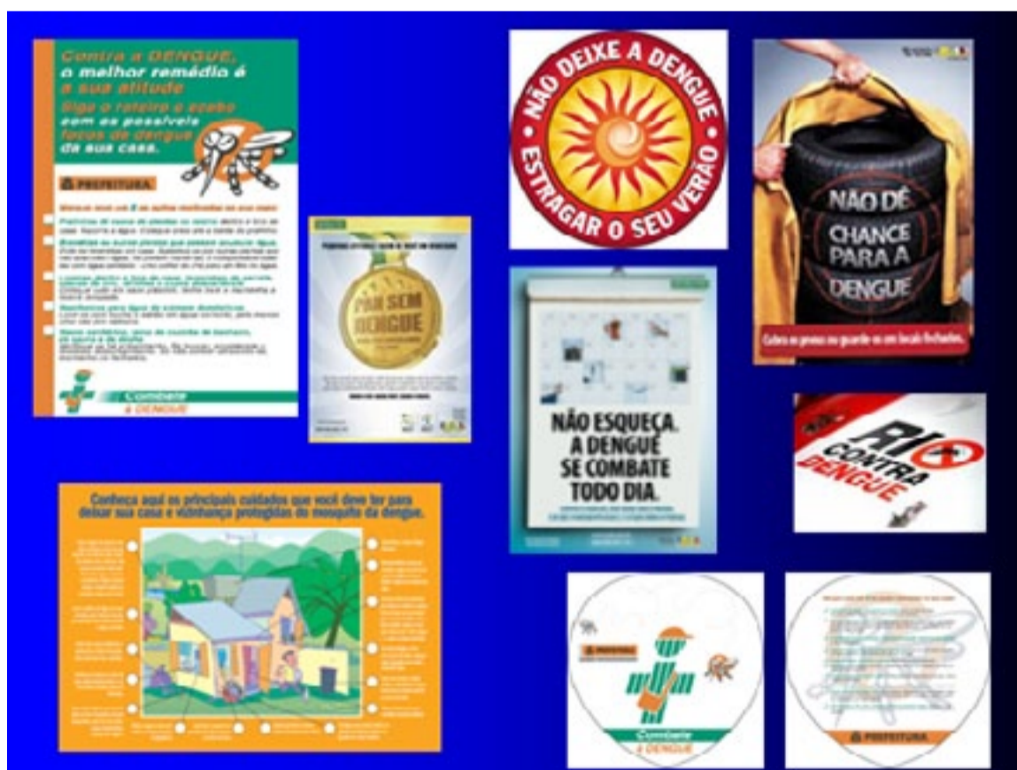
Figura 1 – Exemplos de materiais impressos analisados na pesquisa

Dentro da prática de controle e prevenção da dengue, são produzidos pelas instituições governamentais federais, estaduais e municipais materiais como cartazes, folhetos, cartilhas, outdoors, busdoors, anúncios televisivos, páginas de internet e outros. Para responder às perguntas sobre o que e como falam as instituições e como circulam sua comunicação, fizemos um mapeamento dos fluxos de produção e circulação desses materiais, do Ministério da Saúde (em Brasília) até a população, passando pelas Secretarias Estadual e Municipal de Saúde. Os materiais, todos produzidos por alguma dessas instâncias públicas, foram também analisados em seu conteúdo.