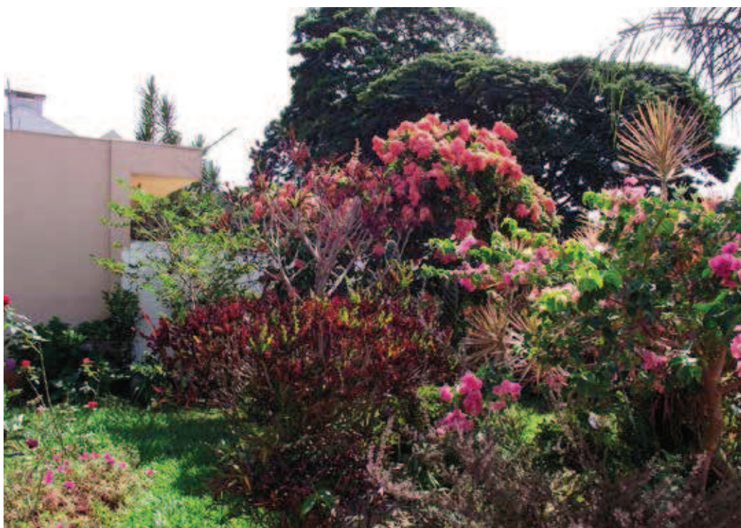
Figura 3 Patios en barrios de mayor status socioeconómico usualmente presentan una alta diversidad vegetal, caso de la Zona 02.