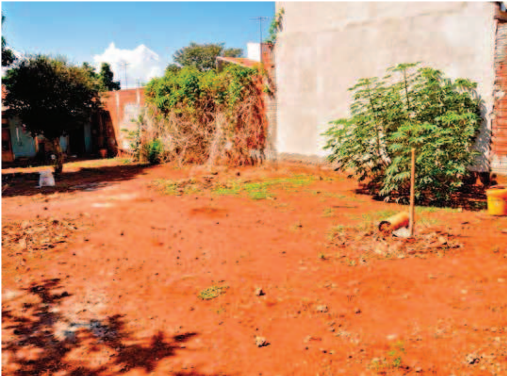
Figura 2 Poca diversidad vegetal en los patios del Jardim das Torres . Foto: Fabio Angeoletto – 2015

La desigualdad en el acceso a la flora y sus beneficios es incluso más grave en el Jardim das Torres , una vez que, diferentemente del barrio Zona 02, donde hay dos parques cercanos, no existe allí ningún área verde, hecho que aumenta sustancialmente la importancia del aumento de la cobertura vegetal, principalmente aquella de carácter arbóreo y arbustivo. Efectivamente, patios son estratégicos al incremento de áreas verdes en barrios donde hay escasez de vegetación. (RUDD; VALA; SCHAEFER, 2002). No se trata meramente de una cuestión estética: varios estudios correlacionan barrios abundantemente arborizado a una menor incidencia de diversos tipos de enfermedades, como las respiratorias. (TAKANO; NAKAMURA; WATANABE, 2002; TZOULAS; KORPELA; VENN, 2007).