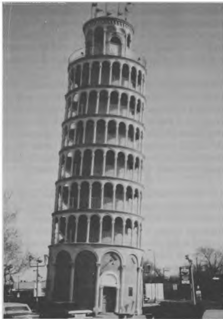
Fig. 5 - Deslocamentos do templo, da percepção e da geografia: instant history na era da informática. Desde Disneyworld a esta reprodução da "Torre de Pisa" em Chicago.

destas imagens é a de um positivismo ingênuo que, embora já admita que as cidades do futuro não se parecerão à utopia de Flash Gordon, ainda não notou que a cidade do futuro já está presente e se parece muito mais com as distopias sugeridas por filmes como Bladerunner e Boys'n the Hood , ou por paisagens como as de Nova York pintadas por Will Eisner, criador do Spirit .