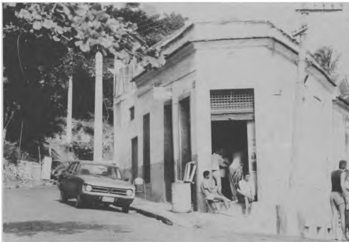
Fig. 2. -A conduta e o comportamento resultam da percepção, ao mesmo tempo que também dão significado às paisagens. (Esquina no Morro do Pinto, área portuária do Rio de Janeiro)

As paisagens “povoadas” assumem significados específicos, complementares ou mesmo diferentes dos que inferimos antes de serem apropriadas pelo uso. Os arranjos de assentos em local público podem potencializar a conversa ou não, a projeção de sombra de um prédio define áreas “humanizadas”, os atributos físicos de um lugar podem fazer com que ele fique deserto a maior parte do tempo, o desenho de uma calçada pode levar os transeuntes a diferentes experiências perceptivas e definir áreas comportamentais (Fig. 2). Os estudos comportamentais têm assumido grande importância para a programação arquitetônica e urbanística, no sentido de ajudar a prever melhor as respostas humanas aos ambientes construídos.