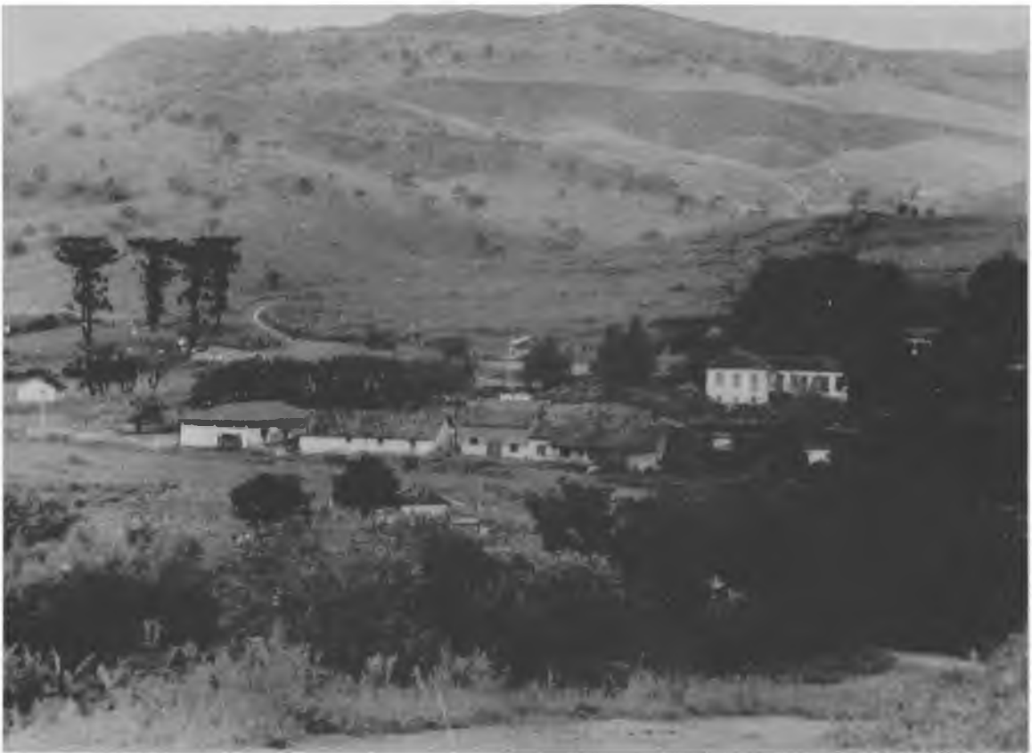
Fig. 1-A percepção de paisagens naturais tem efeitos positivos comprovados sobre a saúde mental. (Fazenda em Cambuquira, MG)

1. Primeiramente, destacamos as preocupações mais diretamente ligadas à medicina ou à psicologia terapêutica. Comprovou-se que a percepção ambiental influencia a própria saúde do homem, cujas evidências foram muito bem resumidas em recente artigo da psicóloga Ruth Parsons 2 . Ela mostra que, por um lado, há processos psicológicos ligados a fatores afetivos e preferências ambientais: paisagens e ambientes naturais, por exemplo, têm efeitos positivos sobre a fadiga mental (Fig. 1). Sugere-se até que certos tipos de arranjos ambientais despertam respostas emocionais inatas, herdadas de nossa própria evolução genética. Por outro lado, ela discute evidências neuropsicológicas que ligam os estímulos perceptivos a processos fisiológicos, como as respostas do sistema imunológico.