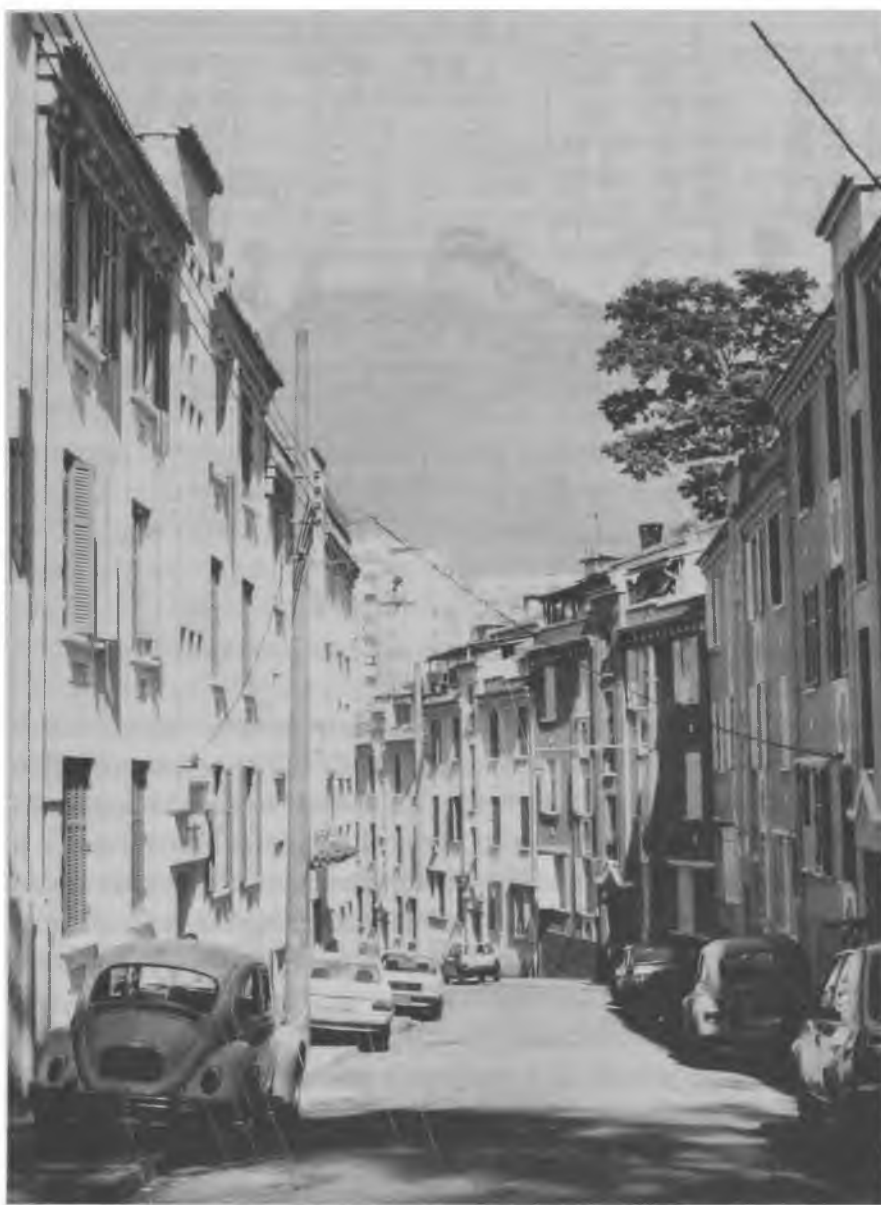
Fig. 3 - A percepção de quadros visuais e de relações topológicas geram sensações e sentimentos. (Rua Pires de Almeida, Cosme Velho, RJ)

4. Tem se dado destaque especial aos estudos sobre a cognição, propriamente dita: momento do processo perceptivo em que se processa o conhecimento e infere-se significados. Evidentemente, sendo a percepção um processo individual, cada um de nós vê uma paisagem diferente. Não apenas vemos paisagens fisicamente diferentes, por conta de nossas capacidades perceptuais individuais, como suas imagens e