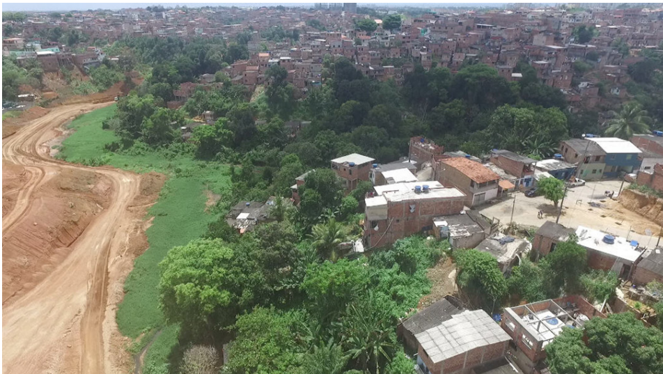
Figura 3: Trecho II, margem direita do rio Mocambo durante construção da via. Na planície de inundação, a vegetação composta de gramíneas e herbáceas que cobrem a lâmina d'água e, ao fundo, nas áreas mais inclinadas, vegetação de grande porte e o bairro de Canabrava. Foto: Associação Cultural e Esportiva da Comunidade de Canabrava, março de 2017.

* Dados Autorização de Supressão de Vegetação nº 2015-Sucom/DAL/CLA/ASV-005, Processo Administrativo nº PR 75 2014 1641 de Licenciamento Ambiental. Fonte: Elaborado pela autora.