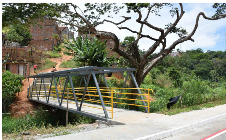
Figura 5: Em primeiro plano, a linha que demarca a ciclovia, ponte sobre o Rio Mocambo e escada de acesso.