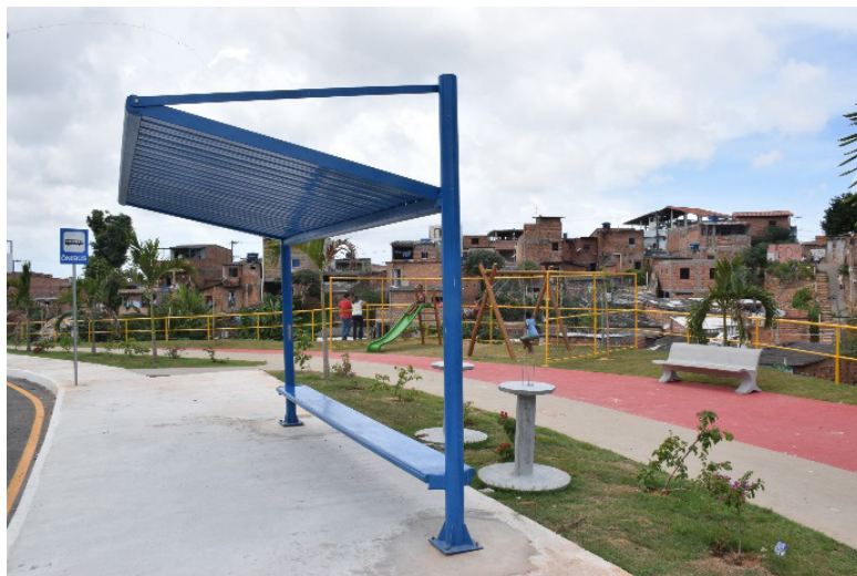
Figura 4: Ponto de ônibus, com ciclovia e equipamentos de lazer ao fundo. fevereiro de 2018.