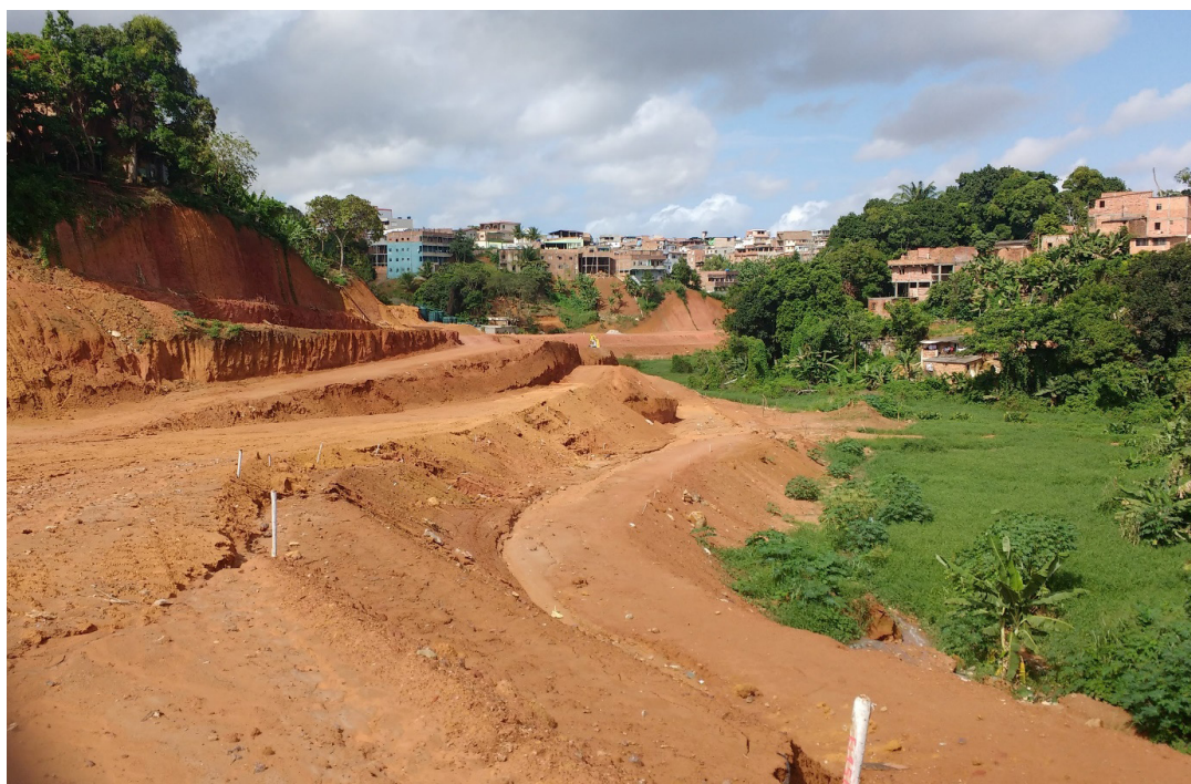
Figura 1: Construção da av. Mário Sérgio na APP do rio Mocambo, com planície de alagamento do lado direito. Foto: Nayara Amorim, março de 2017.

O Plano Diretor de Desenvolvimento Urbano de Salvador (2004) reconhece parte dos bairros das margens do rio Mocambo (Canabrava e Nova Brasília) como Zona Especial de Interesse Social (Zeis), e a Lei nº 9.148/2016 define as Zeis como áreas destinadas à regularização fundiária (urbanística e jurídico-legal) e à produção, manutenção ou qualificação da Habitação de Interesse Social (HIS) e da Habitação de Mercado Popular (HMP). A maior parte do bairro Canabrava corresponde a Zeis do tipo 1, caracterizada por assentamentos precários, habitados predominantemente por população de baixa renda e situados em terrenos de propriedade pública ou privada (SALVADOR, 2016), o que evidencia a diversidade das demandas desses bairros.