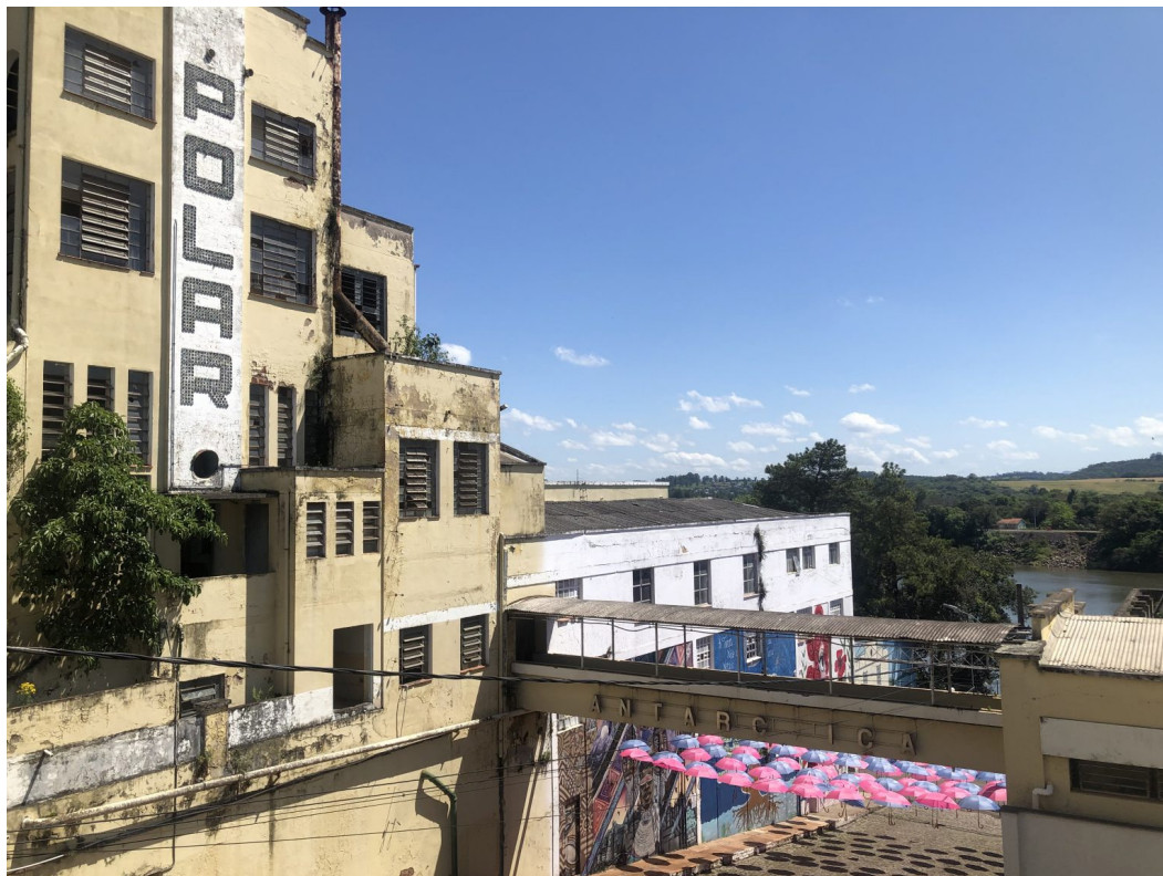
Figura 2 – Sede da antiga Indústria de Bebidas Antártica-Polar S.A., localizada em Estrela (RS). Ao fundo da imagem está o rio Taquari.

As enchentes apresentam elevações variadas, em alguns anos são de grandes proporções e, outros com menos água, a partir do índice de referência do rio. Entre as cheias de maior porte ocorridas no Rio Taquari destacam-se as dos anos de 1873, 1941, 1990 e 2007. A inundação de 1873 foi devastadora, deixando marcas por onde passou. No povoado de São Gabriel, atual município de Cruzeiro do Sul, o Coronel Primórdio Centeno Xavier de Azambuja era proprietário de uma fazenda localizada às margens do Rio Taquari, cujo solar da família estava próximo ao rio. A cheia elevada comprometeu as estruturas do casarão, razão pela qual Coronel Azambuja construiu um novo casarão, dessa vez no alto do morro, na mesma localidade (FERRI, 1991).