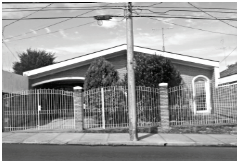
Figura 8A – São Carlos, SP

As formas urbanas são decorrências, nessas cidades, de códigos de obras e planos diretores bastante semelhantes, que vão determinar as larguras das vias e calçadas, altura das edificações, recuos nos lotes, localização de praças e afins, locação de terminais de carga, rodoviá-