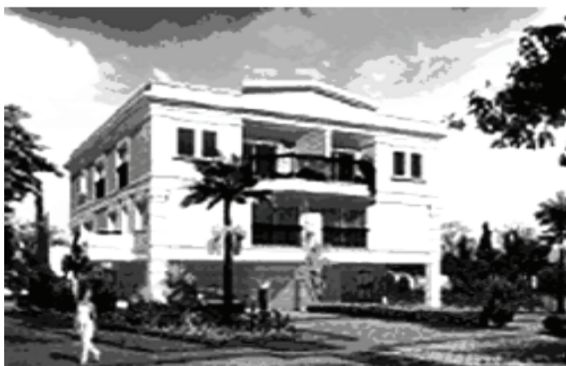
Figura 9B – Ilustração de propaganda imobiliária, notar a similaridade dos padrões fornecidos pelo mercado imobiliário

sobrepõem aos mais diversos tipos de paisagens e ambientes, padrões urbanísticos e arquitetônicos estereotipados, eximindo-se de propor outras soluções mais próprias às realidades locais, correndo o risco de incorrerem nos mesmos erros praticados nos grandes centros, nos quais a crise paisagística-ambiental é um fato. Adotam-se, por exemplo, padrões urbanísticos de zoneamento para áreas verticalizadas, menos rígidos que na cidade de São Paulo, que conta com restrições até avançadas, mas ainda insuficientes.