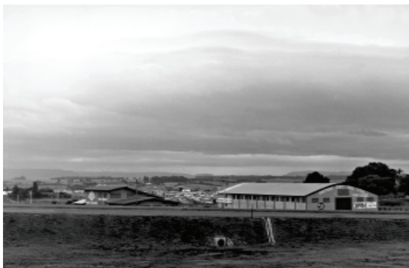
Figura 4 – Rio Claro, SP Crédito: Autora

Figura 4 , sendo que estas barreiras, naturais ou construídas já foram, em sua maioria, ultrapassadas pelo crescimento da mancha urbana.