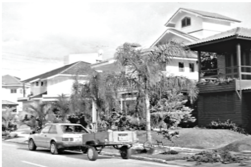
Figura 9A – Bairro residencial de classe média alta, em Florianópolis, SC. Os padrões arquitetônicos aqui presentes fornecem o repertório formal, sendo que, por sua vez, também são cópias de elementos encontrados em outros centros, em um processo de retroalimentação