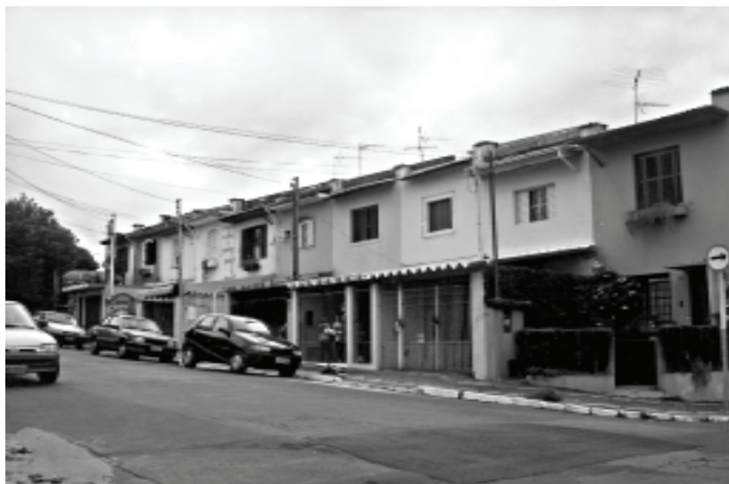
Figura 6A – Limeira, SP