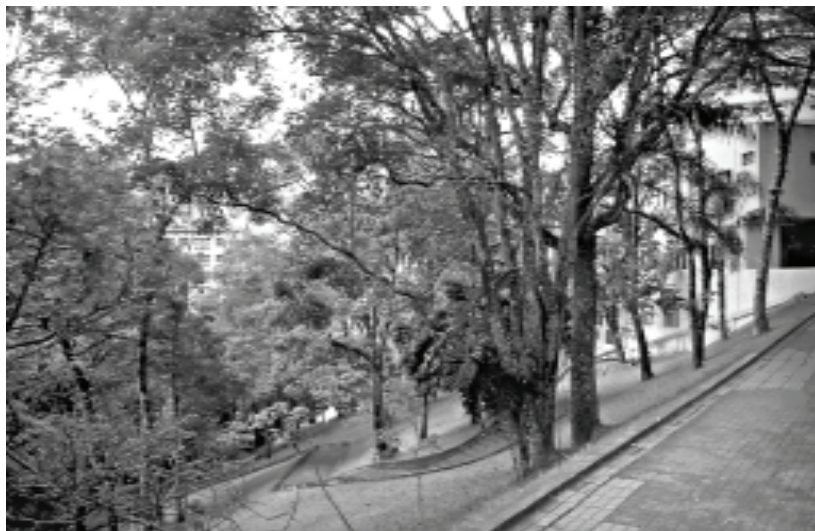
Figura 10A – Águas de Lindóia, SP

De fato, essas situações só ocorrem em contextos particulares, como no caso de condomínios fechados, em alguns projetos de praças e parques urbanos, em cidades turísticas e/ou históricas, ou qualquer situação em que o enfoque seja centrado no pedestre e no estar em público, e não área de passagem, como pode ser observado nas Figuras 10A e 10B.