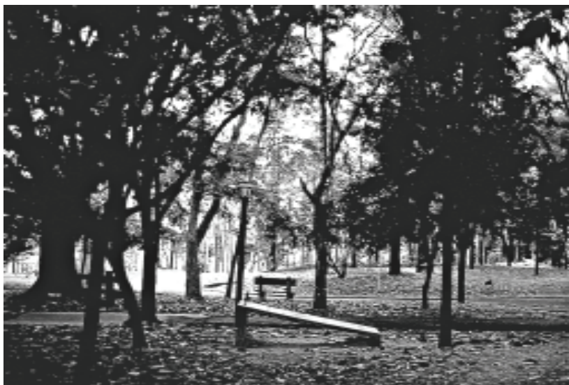
Figura 10B – Bauru, SP

Essa ocorrência pode ser também observada em assentamentos espontâneos, no caso favelas, na qual a organização independe do automóvel.