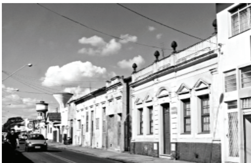
Figura 6B – Rio Claro, SP