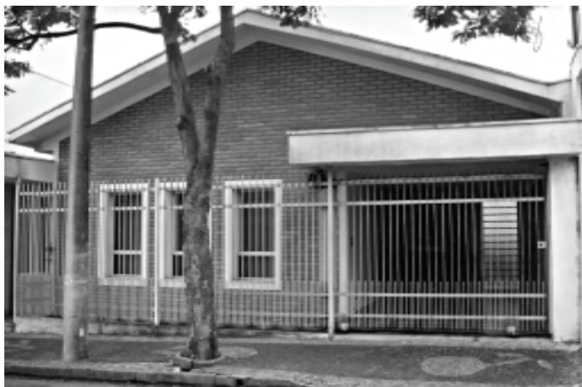
Figura 8B – Limeira, SP