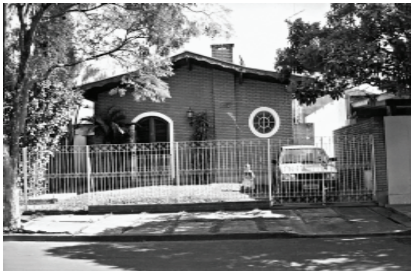
Figura 7A – São Carlos, SP