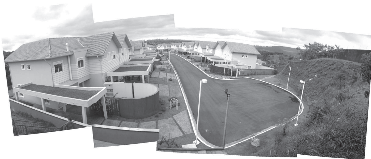
Figura 1: Condomínios suburbanos. Localizados nas partes rurais dos municípios, esses empreendimentos, geralmente, configuram-se como grandes empreendimentos residenciais, planejados ou não por um mesmo empreendedor. Estão distantes, em média, cerca de 30 km do centro histórico de São Paulo.

A seguir apresentaremos periodização da evolução do crescimento desses empreendimentos na região metropolitana e, mais à frente, as suas principais características morfológicas de modo a apontar as principais características formais que estão vinculadas ao amadurecimento conceitual deste produto imobiliário e à sua aceitação por parte do mercado consumidor. Falar do impacto destas estruturas na paisagem sugere alguns meios de compreensão de um fenômeno que, senão inédito, é um dos motores da dispersão da mancha urbana da região metropolitana.