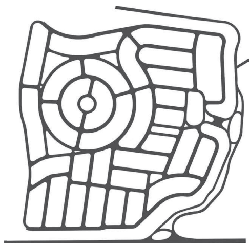
Figura 4: Estruturas em forma de rede. As vias internas estão integradas em um circuito fechado, com um único ponto de conexão com a área externa