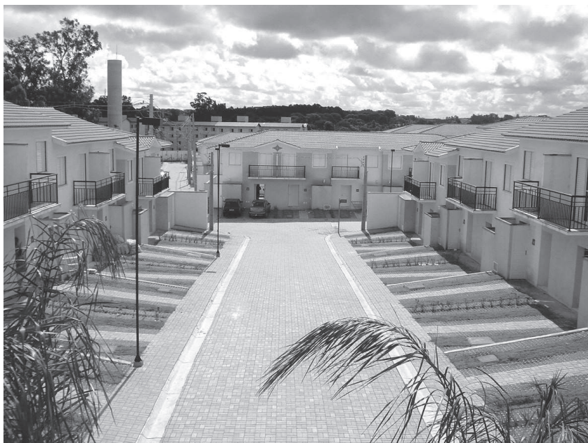
Figura 2: Condomínios intra-urbanos de borda. Trata-se dos empreendimentos localizados nos limites entre as áreas urbanas e rurais do município, em especial nas partes de dispersão urbana. Geralmente a existência de fartas glebas permite que esses empreendimentos alcancem expressiva área construída e um número significativo de unidades residenciais. Distanciam-se cerca de 15 km do centro da capital.