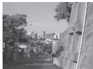
Figura 10: Nível 5