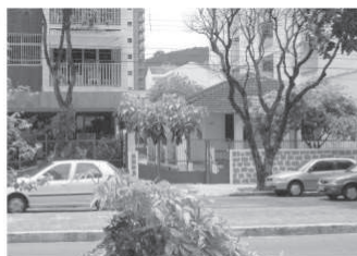
Figura 9: Nível 4