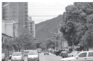
Figura 7: Nível 2