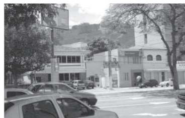
Figura 8: Nível 3