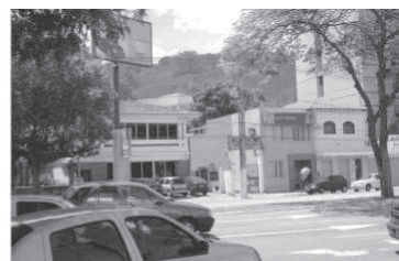
Figura 8: Nível 3