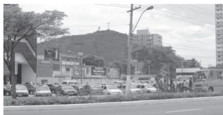
Figura 6: Nível 1

Este entendimento, conduziu a pesquisa ao desdobramento que permitisse examinar e classificar os espaços públicos e suas apropriações.