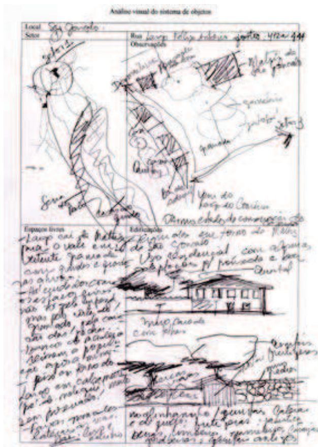
Figura 1 Ficha de análise visual aplicada na pesquisa de campo.

Para verificá-la, foram deslindadas as paisagens históricas de Milho Verde e São Gonçalo por pesquisas bibliográfica e documental. Já o quadro de suas paisagens contemporâneas foi construído com base nos dados da pesquisa de campo realizada nos meses de janeiro e fevereiro de 2010, em que se aplicou o método de análise visual e entrevistas. Para a análise visual foram divididos os distritos em setores, onde foram anotados, desenhados e fotografados os aspectos visuais constituidores das paisagens, as infraestruturas, os espaços livres, as tipologias arquitetônicas existentes e outros elementos significativos de cada rua. Os dados foram reunidos em acervo iconográfico e em 61 fichas, como a apresentada na figura 1, de seis setores em Milho Verde e cinco em São Gonçalo. As entrevistas foram aplicadas a 49 moradores (10% da população urbana), um gestor do turismo e três informantes-chave em Milho Verde, e 79 pessoas (10% da população urbana), um gestor do turismo e cinco informantes-chave em São Gonçalo.