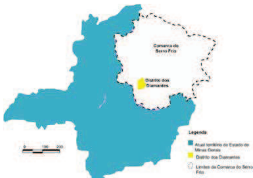
Figura 2 Localização da comarca do Serro Frio e do Distrito dos Diamantes no Estado de Minas Gerais. Elaborada por Sérgio Mol Bessa. Baseada em Moraes (2007, p. 69).

Os diamantes eram facilmente encontrados nos rios e regatos da região e a produção cresceu tanto que o valor da pedra chegou a perder valor no mercado internacional. Para controlar e diminuir a produção, a metrópole demarca a região criando o Distrito Diamantino (1734).