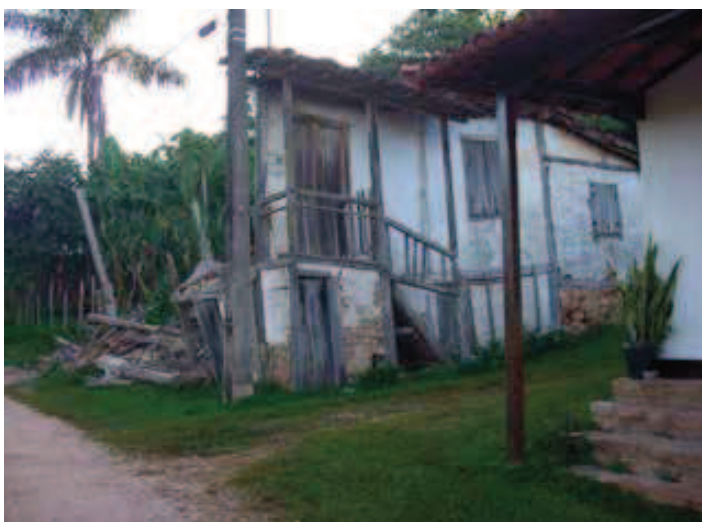
Figura 6 Ruínas de casarão em Milho Verde.