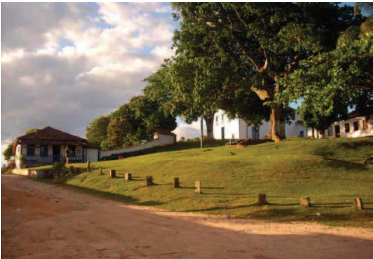
Figura 9 Vista do Largo da Matriz de São Gonçalo. Foto: Altamiro Sérgio Mol Bessa – 2010.