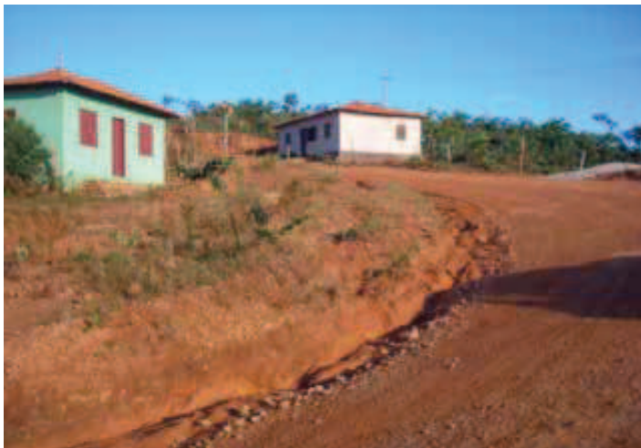
Figura 5 Ocupação de encostas em Milho Verde.

Ausente, o poder público municipal não controla os processos de expansão da mancha urbana de Milho Verde, que têm se dado sobre áreas ambientalmente frágeis (figura 5), ignora a situação de abandono de parte do rico patrimônio histórico, como se pode notar pela figura 6, e não controla o uso e a ocupação do solo, o que tem resultado no fracionamento, na verticalização das edificações e diminuição dos quintais no núcleo colonial para ampliar a oferta de pousadas, casas de veraneio e de aluguel por temporada.