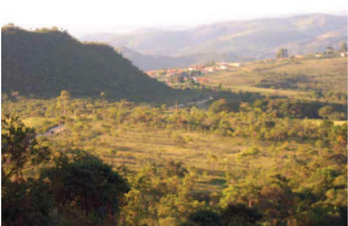
Figura 3 Vista do Distrito de Milho Verde. Foto: Altamiro Sérgio Mol Bessa – 2010.

Já nas primeiras décadas do século XVIII, a Coroa instala em Milho Verde um quartel e um posto fiscal, citados nos relatos dos viajantes John Mawe e Auguste de Saint-Hilaire, com o objetivo de controlar todas as entradas e saídas de víveres, diamantes e pessoas. Milho Verde torna-se, desta forma, o portão por onde entravam e saíam todas as coisas no Distrito dos Diamantes. “A posição, bem no meio da estrada que liga o Serro a Diamantina, no alto de um platô com vasta vista, era motivo de sobra para a escolha do lugar.” (SANTIAGO, 2006, p.106).