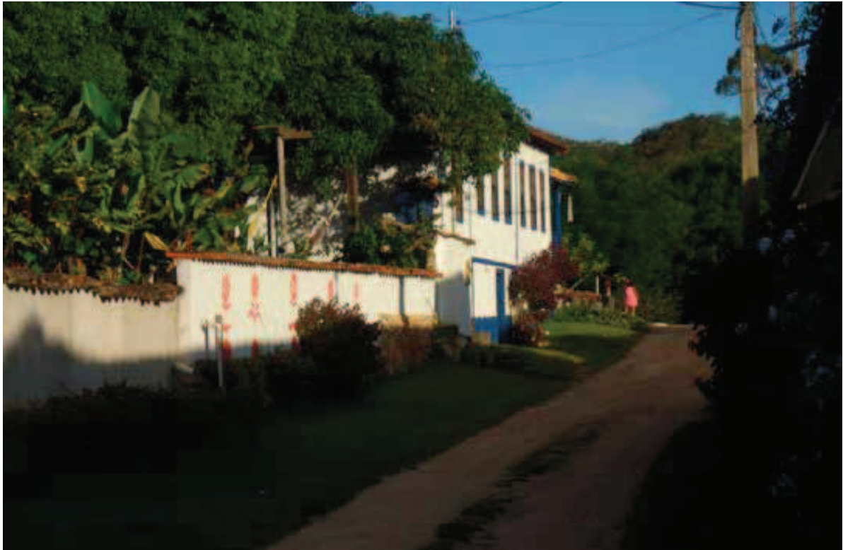
Figura 10 Muro de embasamento de pedras e parede de alvenaria rebocada e caiada. Foto: Altamiro Sérgio Mol Bessa – 2010.