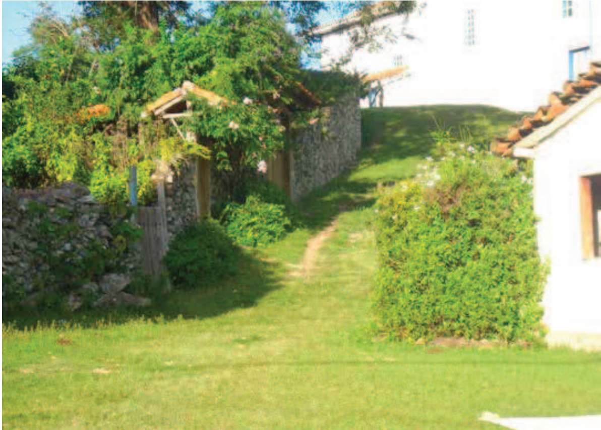
Figura 8 Muro de pedras e cercas-vivas em São Gonçalo. Foto: Altamiro Sérgio Mol Bessa – 2010.