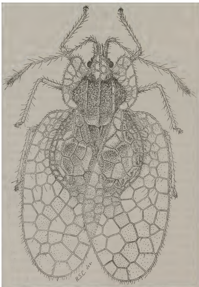
Fig 1 — Leptobyrsa steini (Stål) — (Parátipo)

Nigricans, nigro-fusca vel subferruginea; antennis pilosis, pedibus carinisque 3 subfoliaceis parallelis thoracis pallide testaceo-flavis; thorace utrimque valde dilatato, parte dilatata antrorsum sensim latiore et producta, extus recta, postice rotundata; vesicula parva, sed admodum elevata et antrorsum producta; capitis apicem superante; sagenis vitreis, amplis, fusco-venosis, areis mediis conjunctim elevatis, medio fovea magna impressis. ♂. Long. 4. Lat. 2.1/3 Millim. — (Mus. Holm. et Stål) (Rio Hemipt., I, 1858, p. 64).