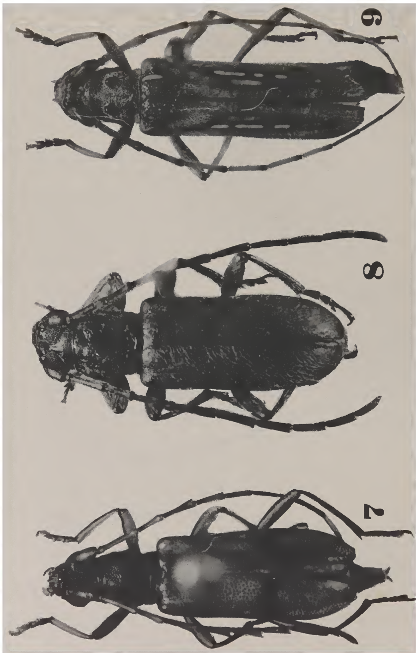
Fig. 7, Brasilianus fasciatus , sp. n.; 8, B. pisinnus , sp. n.; 9, Eburia lachrymosa , sp. n. (Pastore foto).