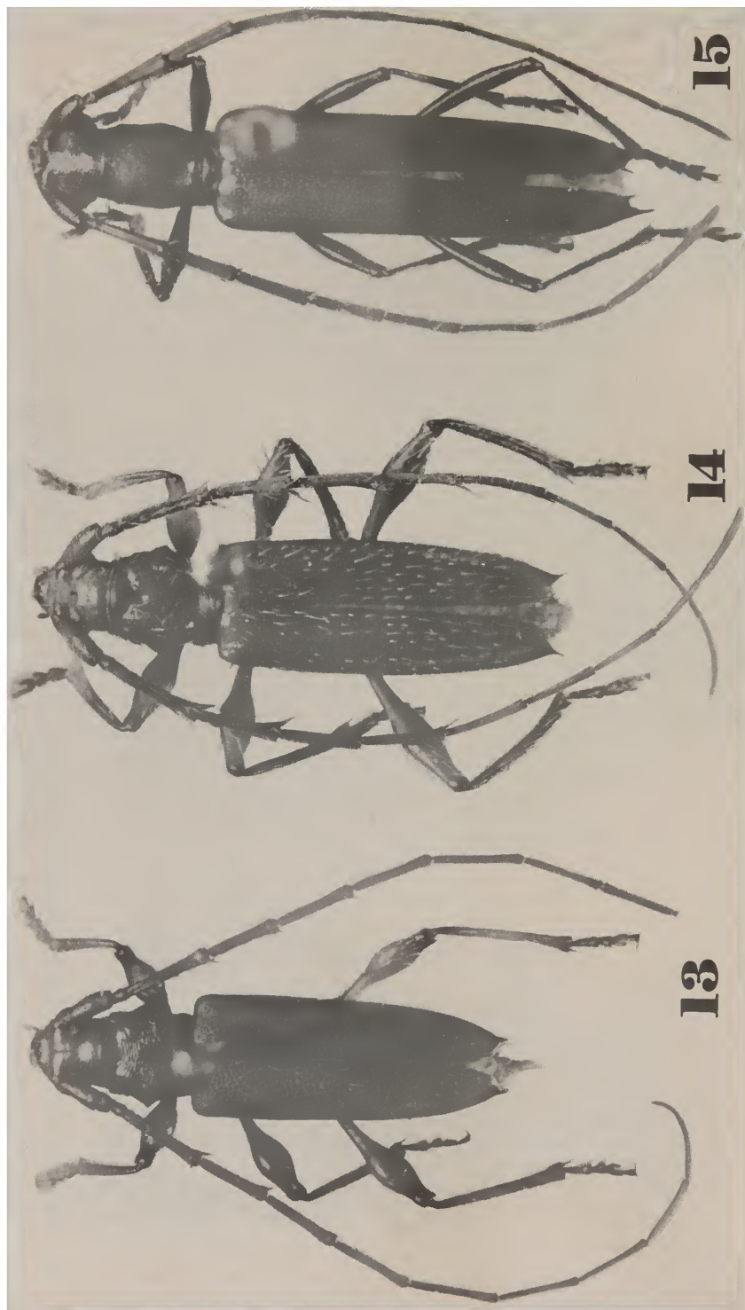
Fig. 13, Periboeum bolivianum , sp. n.; 14, P. obscuricorne , sp. n.; 15, Amethysphaerion nigripes , sp. n..