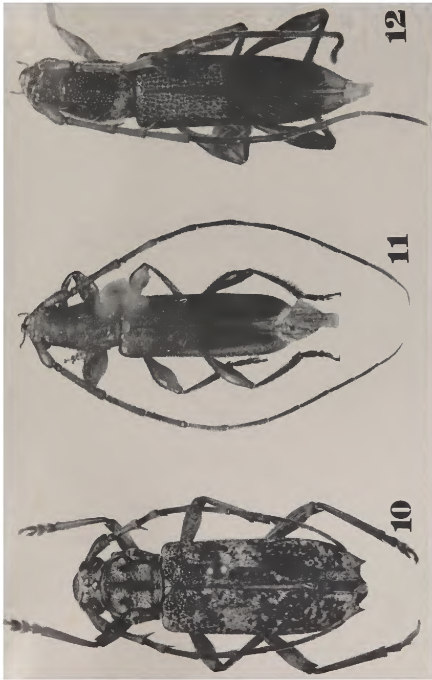
Fig. 10, Elaphidion njumanii Haldeman; 11, Etymosphaerion unicolor , sp. n.; 12, Centrocerum divisus , sp. n. (Pastore foto).