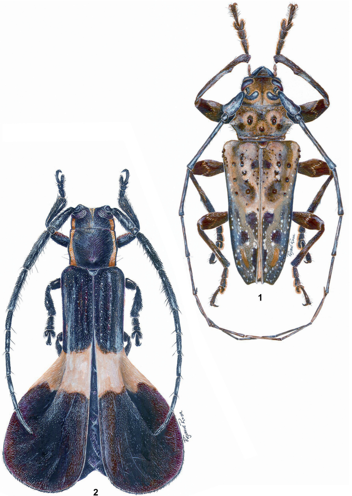
FIGURAS 1-2: 1, Oreodera mageia sp. nov., parátipo macho, comprimento 28,9 mm; 2, Icupima ampliata sp. nov., holótipo macho, comprimento 12,0.