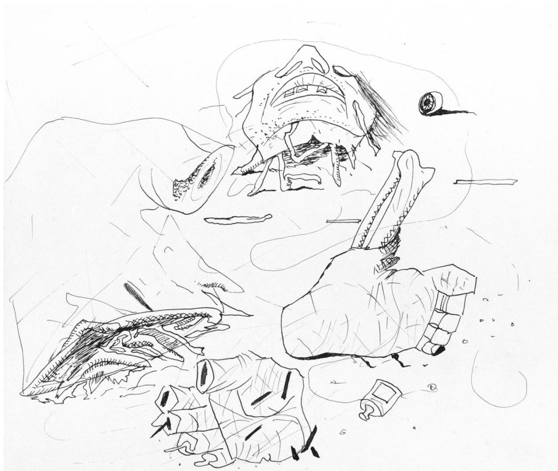
Fig. 4. Restos de homem . Candido Portinari, 1941.

serve para destacar as partes, e focar exclusivamente os restos de corpos humanos (veja a imagem 4). 10