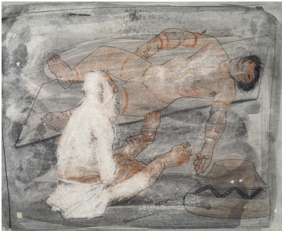
Fig. 5. Índio e Hans . Candido Portinari, 1941.

Por se destacar dos demais desenhos, a espectadora é levada a tomar a imagem como uma chave interpretativa do conjunto dos desenhos. A diferença entre as ilustrações de Staden e as de Portinari é notável. Ao invés de pretenderem ilustrar , os desenhos modernistas põem o cativo de Staden e o desfecho da guerra colonial numa nova luz. Enquanto as xilogravuras originais ressaltam o confronto violento entre índios e colonizadores europeus, os desenhos de Portinari destacam um índio moribundo e um europeu impassível, o efeito devastador da colonização nas populações indígenas. 11 O retrato de Portinari da morte de um índio contraria as premissas de representações convencionais do passado colonial: o que se torna visível e memorável não é a resistência, a assimilação, ou o sacrifício, mas algo irreconciliável: a morte dos antigos Tupinambás.