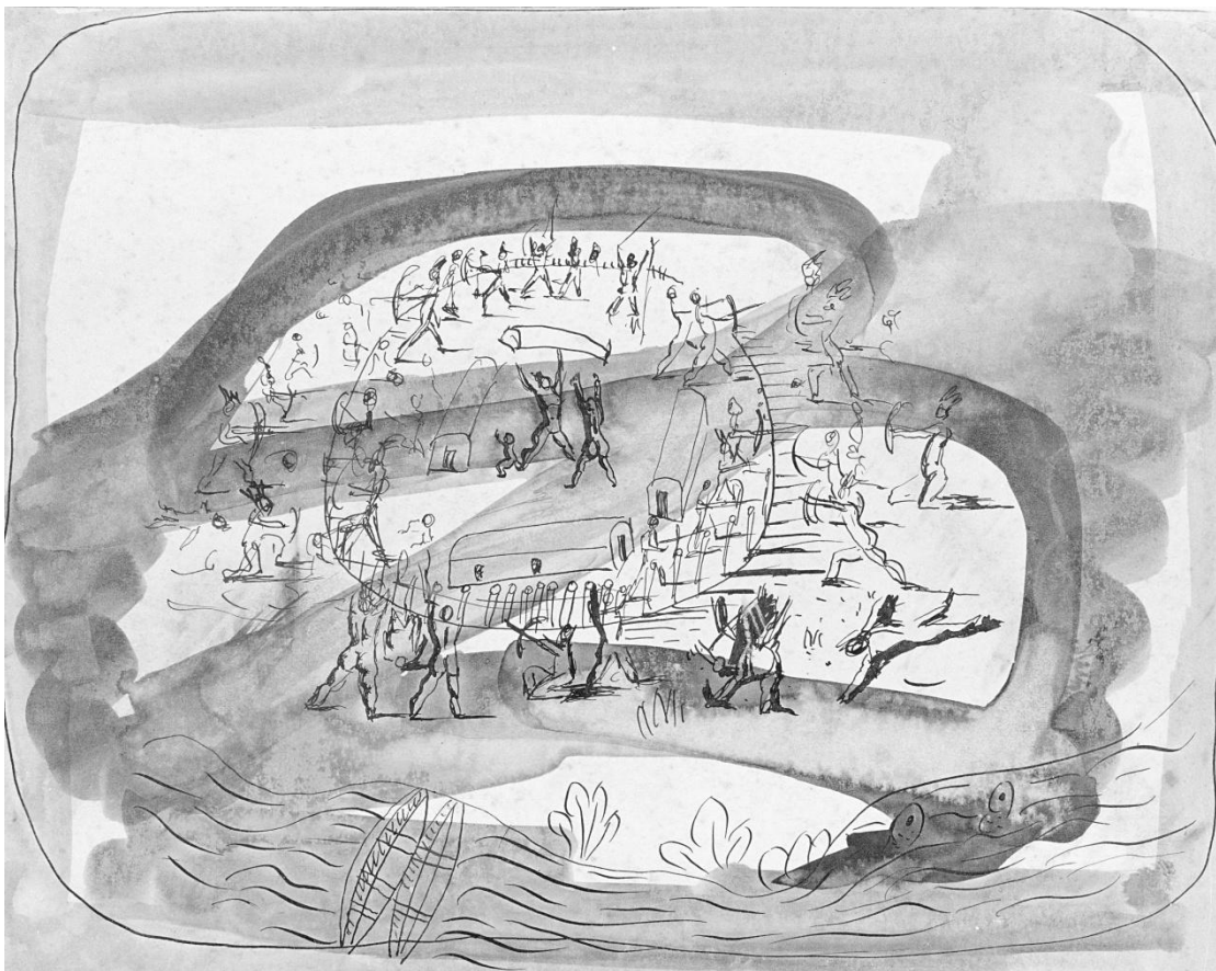
Fig. 2. Índios atirando . Candido Portinari, 1941.