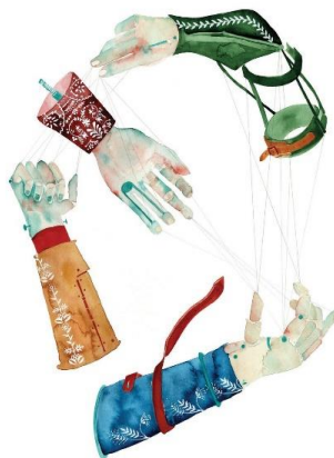
Figura 2: Hanna Jung ilustra Kleist ( Über das Marionettentheater , 2018)

Fonte: KLEIST, Heinrich von. Über das Marionettentheater . Illustrationen von Hanna Jung. Kunstanstifter, 2018.