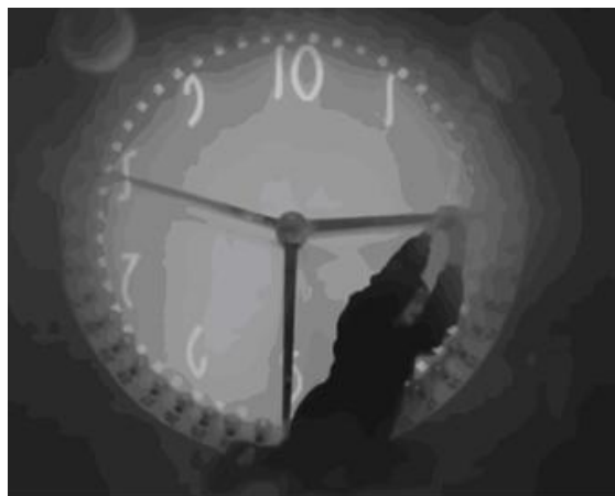
Figura 1. Freder, operando a máquina após trocar de lugar com o trabalhador.

Essa mesma máquina (Figura 1) é palco para outra simbologia. Quando o protagonista é quem está operando a máquina-relógio, ele se ajoelha, como se estivesse carregando uma cruz. Essa postura de sacrifício reforça ainda mais a construção de Freder como o “salvador”, assumindo o papel de uma figura messiânica.