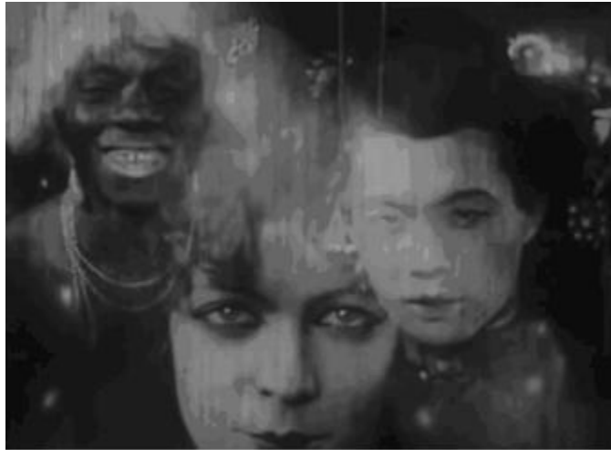
Figura 5. Imaginação do trabalhador sobre o local Yoshiwara (parte 1)

SALDANHA, V.; CORNELSEN, E. – Representações de lazer e de suas implicações políticas