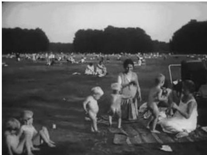
Figura 14. Cena de famílias passando o domingo em um parque

considerado nobre e de origem britânica, como o hóquei sobre a grama, ou de passear de pedalinho ou de barco nas águas do Wannsee, ou de outros lagos da cidade de Berlim, como o Müggelsee, o Niklassee e o Schlachtensee, não deixam de buscar também na natureza momentos de relaxamento e diversão, como demonstra uma cena de Menschen am Sonntag na qual numerosas famílias proletárias se divertem fazendo piquenique em um grande parque da cidade (Figura 14), o que nos faz lembrar novamente dos famosos desenhos do ilustrador Heinrich Zille: