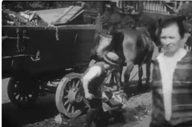
Figura 9. Cena de rua em que é feita a coleta de lixo acumulado na sarjeta

lixo em carroças puxadas a tração animal (Figura 9).