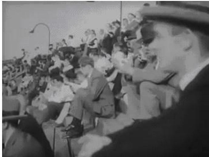
Figura 13. Cena da assistência nas arquibancadas

alemão Menschen (pessoas, seres humanos) ao invés de Leute (pessoas, pessoal) ou Individuen (indivíduos) possui um caráter de abrangência que extrapola o próprio universo das quatro personagens enfocadas às margens do Wannsee, algo que, inclusive, parece corroborar o pensamento de Roberto DaMatta, baseado em Marcel Mauss, ao estabelecer a distinção entre indivíduo e pessoa como “duas formas de conceber o universo social” (DAMATTA 1997: 219). Enquanto o indivíduo figura como “realidade concreta, natural, inevitável, independente das ideologias ou representações coletivas e individuais” (DAMATTA 1997: 221), a pessoa seria caracterizada como “uma vertente coletiva da individualidade, uma máscara colocada em cima do indivíduo ou entidade individualizada (linhagem, clã, família, metade, clube, associação etc.) que desse modo se transforma em ser social” (DAMATTA 1997: 223).