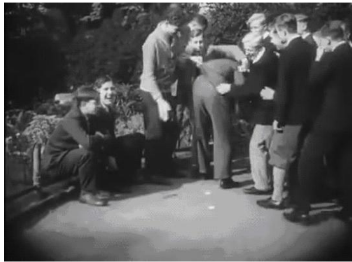
Figura 11. Estudantes ao ar livre

SALDANHA, V.; CORNELSEN; E. – Representações de lazer e de suas implicações políticas