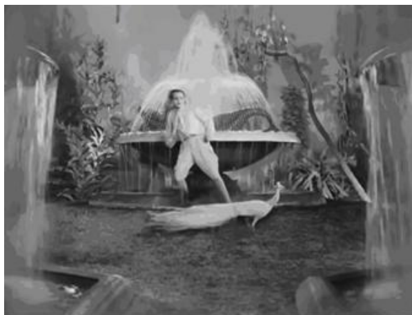
Figura 4. Espaço ídílico do Jardim