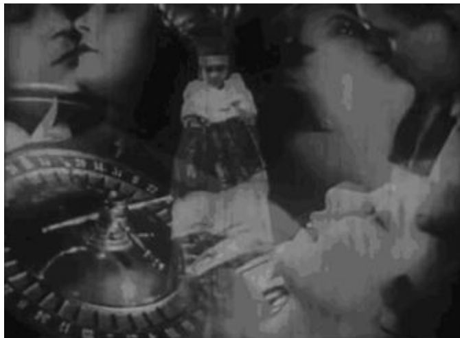
Figura 6. Imaginação do trabalhador sobre o local Yoshiwara (parte 2)