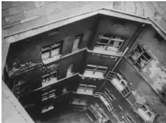
Figura 8. Um edifício de moradias insalubre