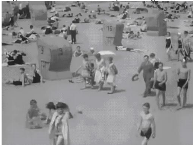
Figura 16. Cena de banhistas na praia do lago Wannsee

da cidade a perder de vista. Em sequência, voltando ao Wannsee, não poderia faltar também uma tomada da praia de água doce, com seus banhistas nas areias (Figura 16):