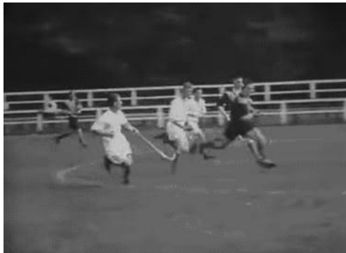
Figura 12. Cena de uma partida de hóquei sobre a grama

Em seguida, há cenas de uma partida de hóquei sobre a grama, que alternam entre o campo de jogo e a arquibancada, de modo que podemos pensar tanto na prática esportiva daqueles que jogam (Figura 12), quanto na prática do torcer como lazer daqueles que formam a assistência ao redor do gramado (Figura 13):