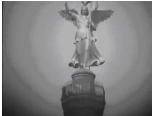
Figura 15. Tomada da Siegessäule , com a deusa romana Viktoria em seu topo e um mirante ao redor de seu pedestal

Todavia, o próprio poder é referenciado no filme, em uma breve cena na qual um homem, passeando pelo Tiergarten, maior parque de Berlim, originalmente projetado como parque de caça para os reis da Prússia, contempla uma das estátuas de figuras históricas que o adornam. Em intensa montagem, que nos faz lembrar do cineasta soviético Sergei Eisenstein e da famosa cena da “Escadaria de Odessa” em seu filme Bronenosets Potyomkin (1925; Encouraçado Potemkin ), planos detalhe de estátuas de celebridades e de leões de pedra, tomadas em contra- plongée , são seguidas por uma tomada de transição em efeito fade-in e fade-out da Siegessäule , a Coluna da Vitória, com quase 70 metros de altura, cuja construção foi concluída em 1873 para celebrar as vitórias militares prussianas nas guerras contra a Áustria (1866) e a França (1870), que culminaram com a fundação da Alemanha como Estado-nação unificado em janeiro de 1871 (Figura 15).