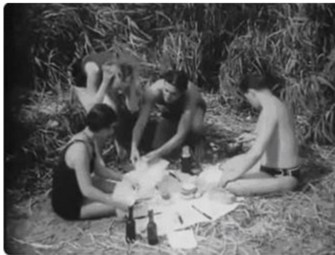
Figura 10. Cena do piquenique às margens do lago

Como mencionado anteriormente, das cinco personagens, uma não participa do passeio: Annie, namorada de Erwin, que fica dormindo em seu apartamento, enquanto ele vai ao encontro de Christl, jovem que conhecera na rua, no dia anterior. Christl, que havia marcado o encontro com Erwin na estação Niklassee do S-Bahn, para de lá seguirem ao Wannsee, traz uma amiga, Brigitte. Wolfgang, amigo de Erwin, também se junta ao grupo (Figura 10).