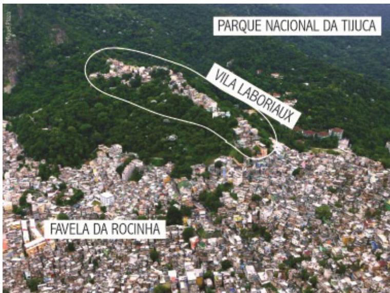
Figura 4. Foto aérea da Rocinha apontando a localização do Laboriaux.

Em seguida, a palavra foi passada para o representante do Fórum de Turismo da Rocinha que, junto com o Presidente da Associação de Moradores do Laboriaux e o representante da ONG Favela Verde, falam do projeto de Ecoturismo de Base Comunitária que está sendo elaborado pela Associação de Moradores do Laboriaux em parceria com a ONG Favela Verde.