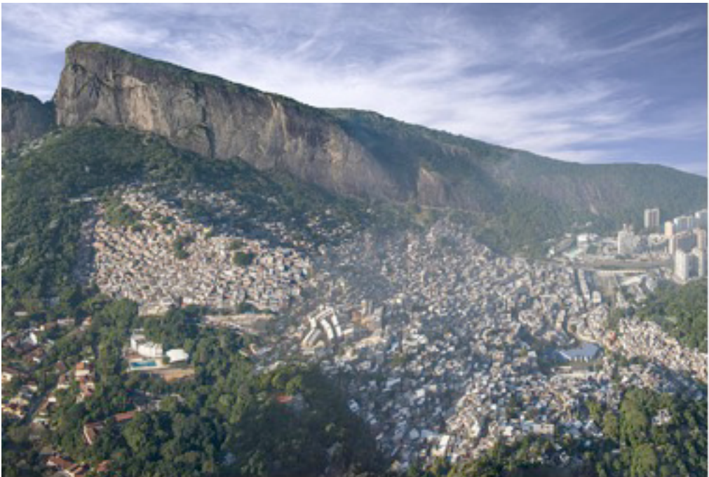
Figura 3. Rocinha.

A Rocinha é a paradigmática favela turística do Rio de Janeiro. Vendida no mercado turístico como “a maior favela da América Latina”, está localizada, assim como o Vidigal, entre Leblon e São Conrado, os bairros mais caros da cidade. Vem atraindo grande número de turistas, na sua maioria estrangeiros, nos mais diversos roteiros organizados por diferentes atores, desde 1992. Tal fenômeno tem despertado o interesse de pesquisadores e moradores, bem como do Estado, que em 2006 reconheceu a Rocinha como atrativo turístico oficial da cidade através de projeto de lei de autoria da Vereadora Lilian Sá (FREIRE-MEDEIROS, 2009, 2013).