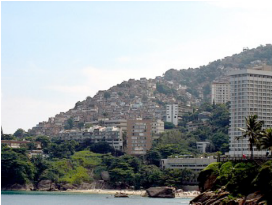
Figura 1. Vidigal.

cido pela sua classe artística de pintores, escultores, atores e cantores, que habita as casas e apartamentos na parte baixa do morro (COUTINHO, 2006). Ao chegar ao Vidigal, o visitante se depara com prédios e casarões, e subindo a encosta, avista a favela. Assim como outras áreas do Rio, teve períodos marcados pela violência e pelo tráfico de drogas. Em janeiro de 2012, o Vidigal recebeu uma Unidade de Polícia Pacificadora (UPP), o que é, segundo alguns grupos de moradores, umas das razões para o crescimento do turismo no local.