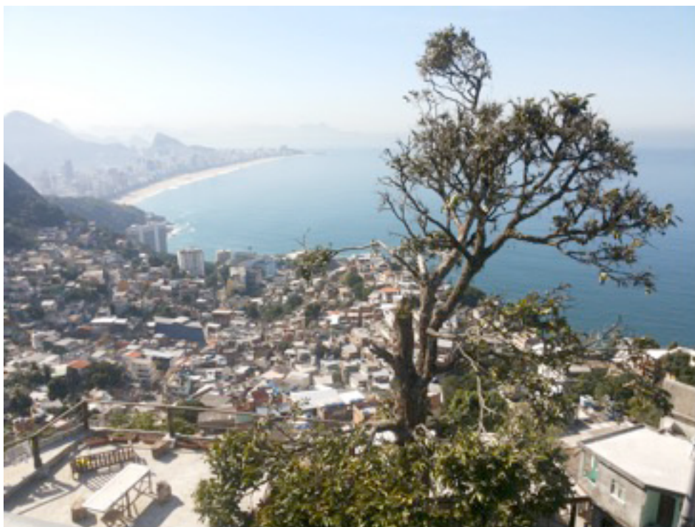
Figura 2. A árvore símbolo do Arvrão com o Vidigal e a cidade ao fundo.

e um representante da Escola de Arte e Tecnologia, projeto social do artista plástico Vik Muniz. Segundo a organização do debate, outros novos empreendedores foram convidados, mas somente os dois citados confirmaram presença e compareceram. Na mesa, os dois representantes compartilharam a preocupação de seus estabelecimentos não estarem sendo plenamente bem-vindos na comunidade e se disponibilizaram a participar do debate para esclarecer quaisquer dúvidas. Ambos, o albergue e o projeto social, têm suas sedes no Arvrão, parte alta do Vidigal, de onde tem-se as melhores vistas da favela e da cidade, e também por onde se acessa a badalada trilha do Morro dos Irmãos. O local é o cenário das principais mudanças no morro, provocadas pela abertura de novos albergues, bares e quiosques, que vem alterando a paisagem da parte alta do Vidigal. As duas iniciativas tiveram grande repercussão dentro e fora da favela. O albergue chama a atenção por ser considerado uma hospedagem luxuosa em meio à favela, com quartos que não deixam a desejar se comparados aos melhores hotéis da cidade. E o projeto social do artista plástico promete muita inovação com uso de um método experimental de educação, que combina arte e tecnologia, desenvolvido pelo Massachusetts Institute of Technology (MIT), respeitada instituição americana de ensino e pesquisa na área tecnológica.