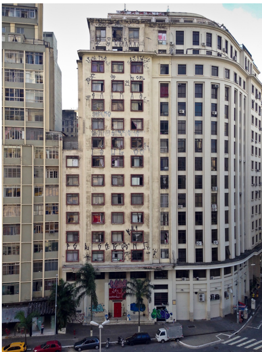
Figura 1. A Ocupação Hotel Cambridge.

A ênfase que esta edição especial oferece sobre o direito à cidade destaca como a noção de ressignificação artística encontra e reage a um conceito inteiramente diferente de participação daquele articulado por Claire Bishop (2004, 2006, 2012) ou Nicolas Bourriaud (2002). Argumento ainda que o que caracteriza e dá forma a esses processos é sua localização. Posicionadas na fronteira porosa entre os espaços de arte contemporânea institucional e não-institucional, essas práticas ocorrem dentro da trama de redes e hierarquias que derivam de múltiplos modos de vida urbana. É essa encruzilhada de eixos – o horizontal e o vertical, o efêmero e o utópico – que oferece à tal reconfiguração seu potencial único, enquanto também expõe uma teorização da já amplamente observada iminência da arte.