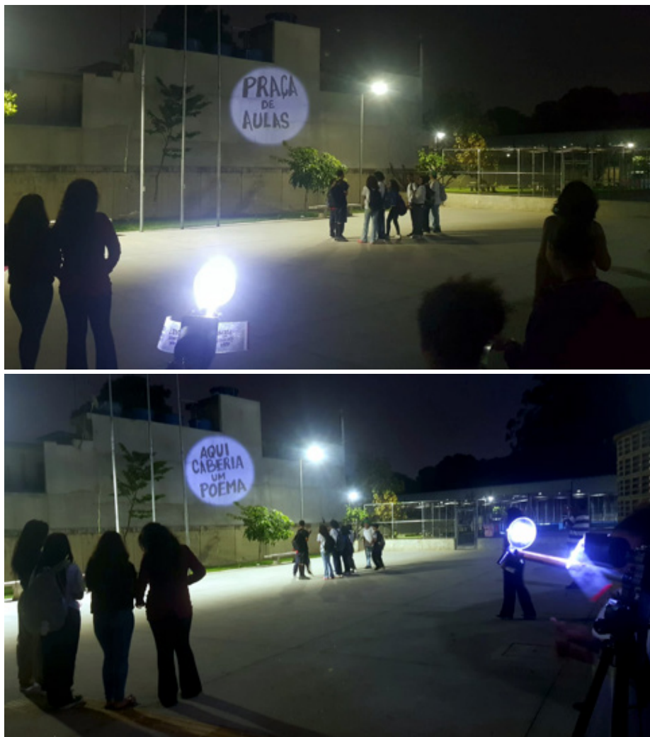
Figuras 6 e 7. Ações mapográficas com Bazuca Poética junto aos jovens do Jardim Gaivotas.

A projeção efêmera — comparada pelos participantes a uma “pescaria” ou “semeadura” — opera como gatilho para debates que transcendem o momento da intervenção, ecoando a ideia de Harvey (2013) sobre o direito à cidade como prática ativa de transformação.