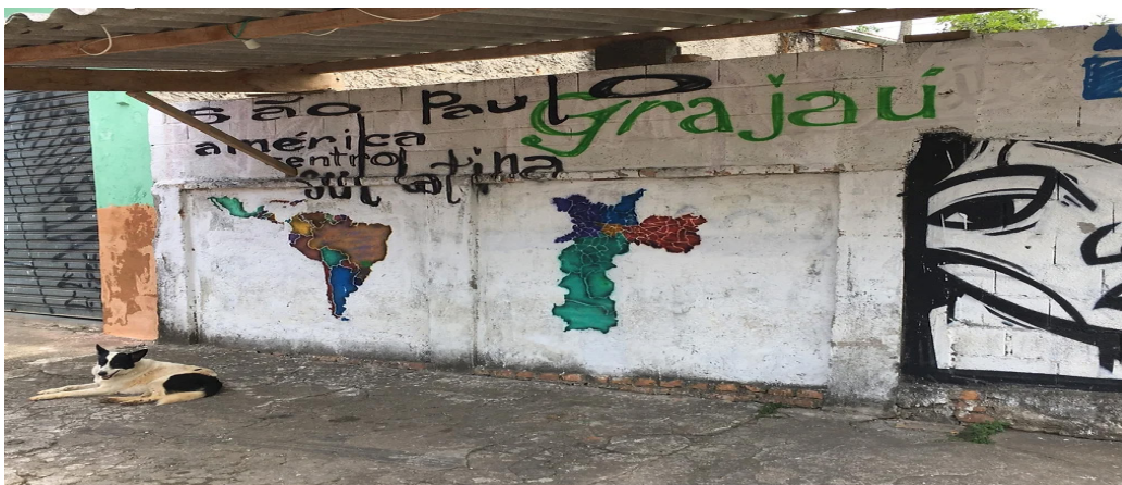
Figura 2. Mapas com técnica mista Stencil, grafitti, tinta de terra Coletivo Imagem

A descrição sobre o avizinhamo com cotidiano da Ilha é um modo de narrar as nuances que aparecem na produção do espaço - seus acessos, caracterizações e cotidiano. No que diz respeito ao espaço produzido, seu caráter político ganha destaque na abordagem mapográfica, revelando relações de poder (Raffestin, 1993) – e potência, como contragolpe. A fim de mobilizar tais vivências e articular às percepções comunitárias como ação da juventude, utilizaremos breve revisão bibliográfica que resultam de ações na Ilha do Bororé (Bassani; Clasen; Ribeiro; Borém; Pardo, 2023; Bassani; Massimetti; Rodrigues, 2019) e Jardim Gaivotas (Bassani; Clasen; Borém, ARQUISUR, 2023) 1 , contribuindo para o debate diante da realização de intervenções no cotidiano por parte das juventudes locais. No que diz respeito às ações que articulam educação ambiental e práticas culturais, a reflexão enunciada entre arte e pertencimento, propõe apresentar resultados por meio de duas principais experiências pregressas, direcionando o debate para o evento realizado pelos jovens “Da Balsa pra cá”, como forma de enfatizar tais percepções.