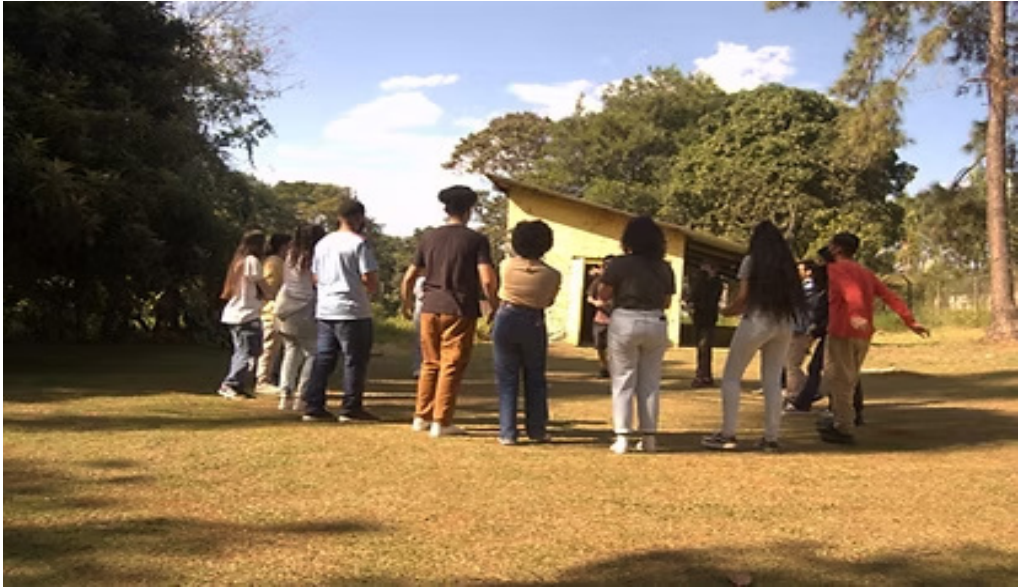
Figura 3. Encontro Núcleo de Arte Educação Ambiental na Casa Ecoativa

“Contracartografia do Bororé – Memória e território” (2018 - 2019), “Memória do Bororé – geografia e cultura do território” (2019 - 2020).