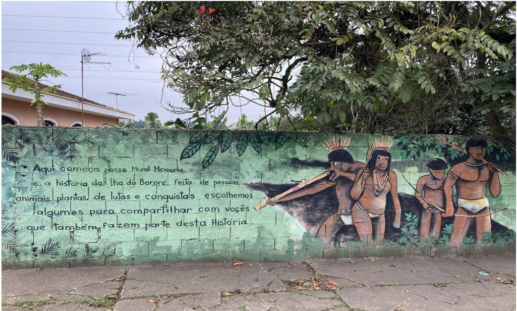
Figura 1. Mural Memória Coletivo Imargem.