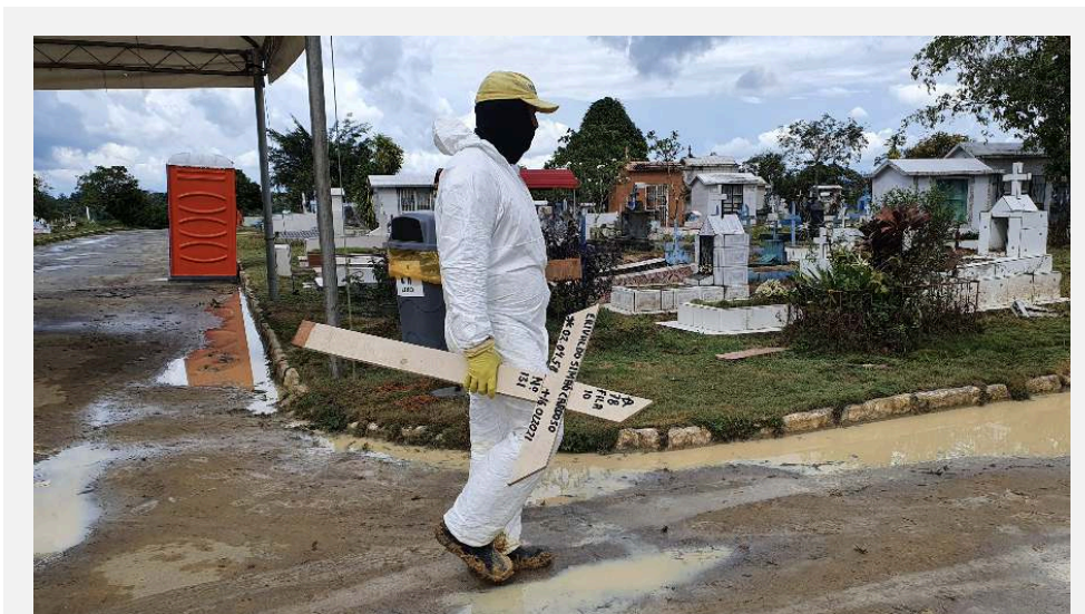
Figura . Coveiro com EPI, de quem não se vê nem o rosto, carrega uma cruz de madeira em cemitério em Manaus - 20 de janeiro de 2021