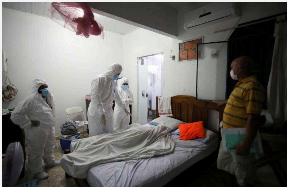
Figura . Agentes de saúde examinam corpo dentro de uma casa em Manaus - 27 de janeiro de 2021