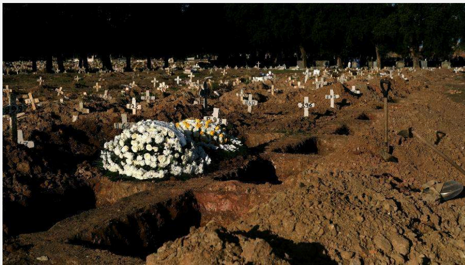
Figura . Vista do Cemitério São Francisco Xavier, no Rio de Janeiro [Ricardo Moraes/Reuters] - 10 de julho de 2020