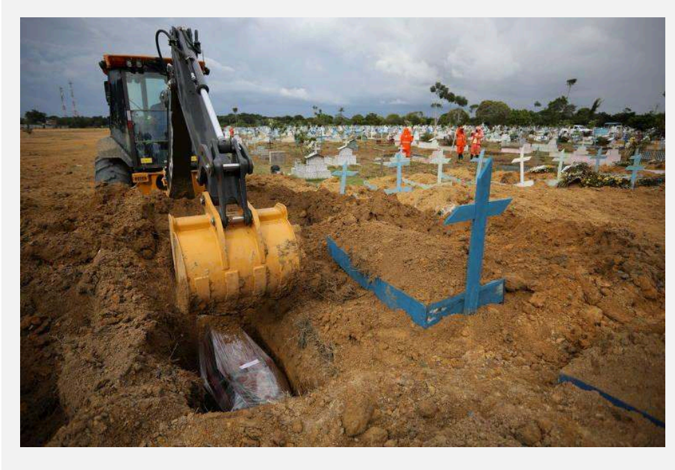
Figura . Escavadeira sobre caixão embalado no Cemitério Parque Taruma, em Manaus - 27 de janeiro de 2021