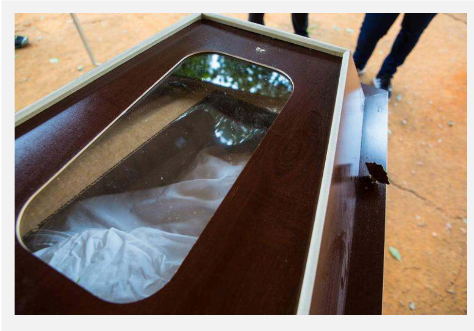
Figura . Foto em close de um caixão no Cemitério da Vila Formosa, em São Paulo - 01 de abril de 2020