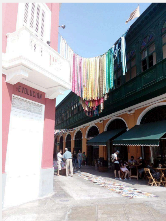
ENTRADA AL PASAJE GÁLVEZ