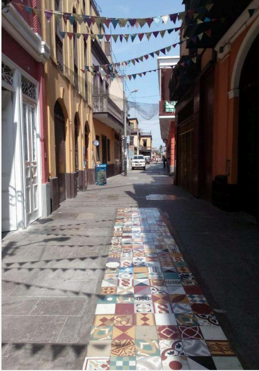
PASAJE GÁLVEZ CORRESPONDIENTE AL ÁREA DE FUGAZ