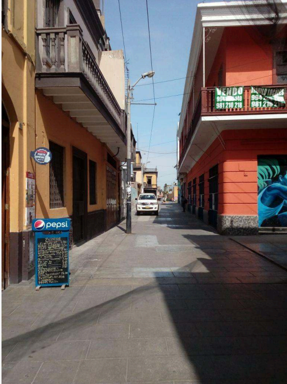
EL MISMO PASAJE GÁLVEZ UNOS METROS MÁS ALLÁ DONDE YA NO SE ENCUENTRA EL PROYECTO FUGAZ