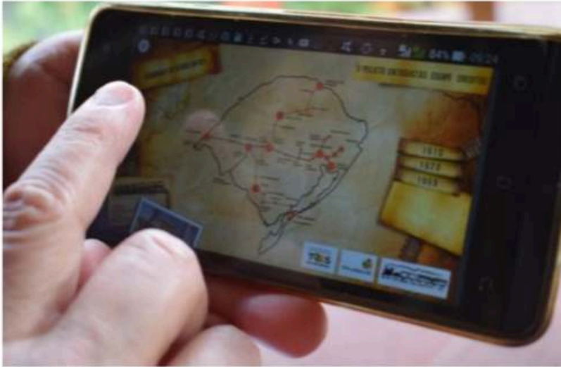
Interface principal do aplicativo do Museu do Trem disponibilizado para celulares – São Leopoldo/RS - Setembro de 2017

divulgação da iniciativa nos seus círculos de sociabilidade e agenciamento das imagens colecionadas. Assim, o totem, enquanto materialidade associada a uma prática de representação do grupo de trabalho, repercutiu para além do ambiente museológico, emergiu enquanto um documento referenciado pelos ferroviários em suas demandas coletivas pelas políticas de patrimonialização da memória ferroviária do Rio Grande do Sul.