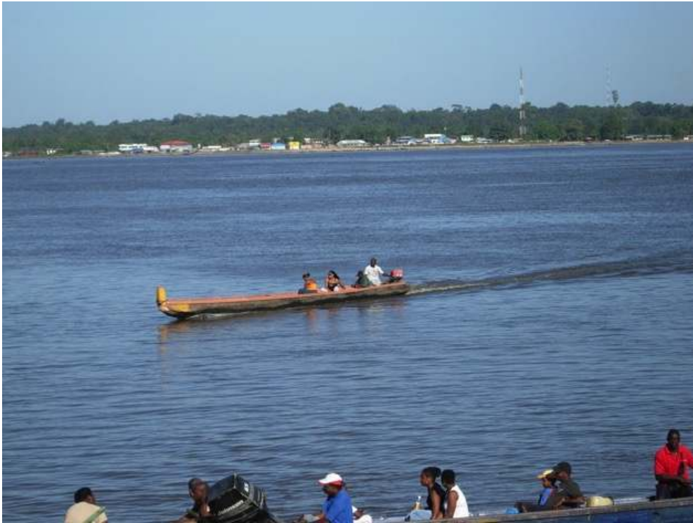
FIGURA 1. St. Laurent du Maroni, o rio /fronteira, ao fundo Albina, cidade surinamesa , créditos CReginensi, 1997

St. Laurent du Maroni /Guiana Francesa, fronteira com Suriname, 1997