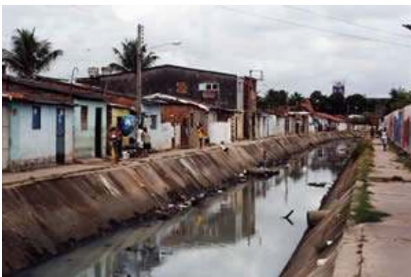
FIGURA 5. O canal que separa as duas favelas, créditos CReginensi, abril de 2001