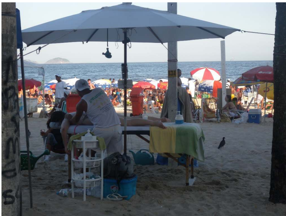
FIGURA 8. Massagista na praia, Posto 5. 16-02-2010