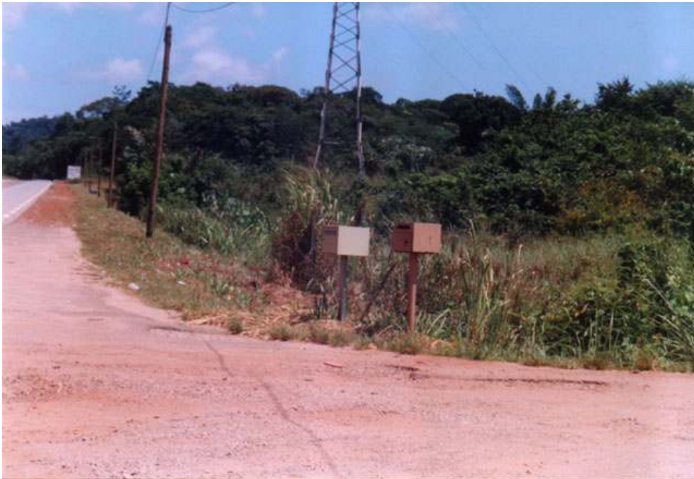
FIGURA 3. Cabassou, entrada da aldeia brasileira, créditos C.Reginensi, 2001