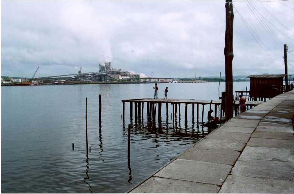
FIGURA 2. Desde Laranjal , vista da fábrica de celulose, créditos C.Reginensi, agosto de 1998