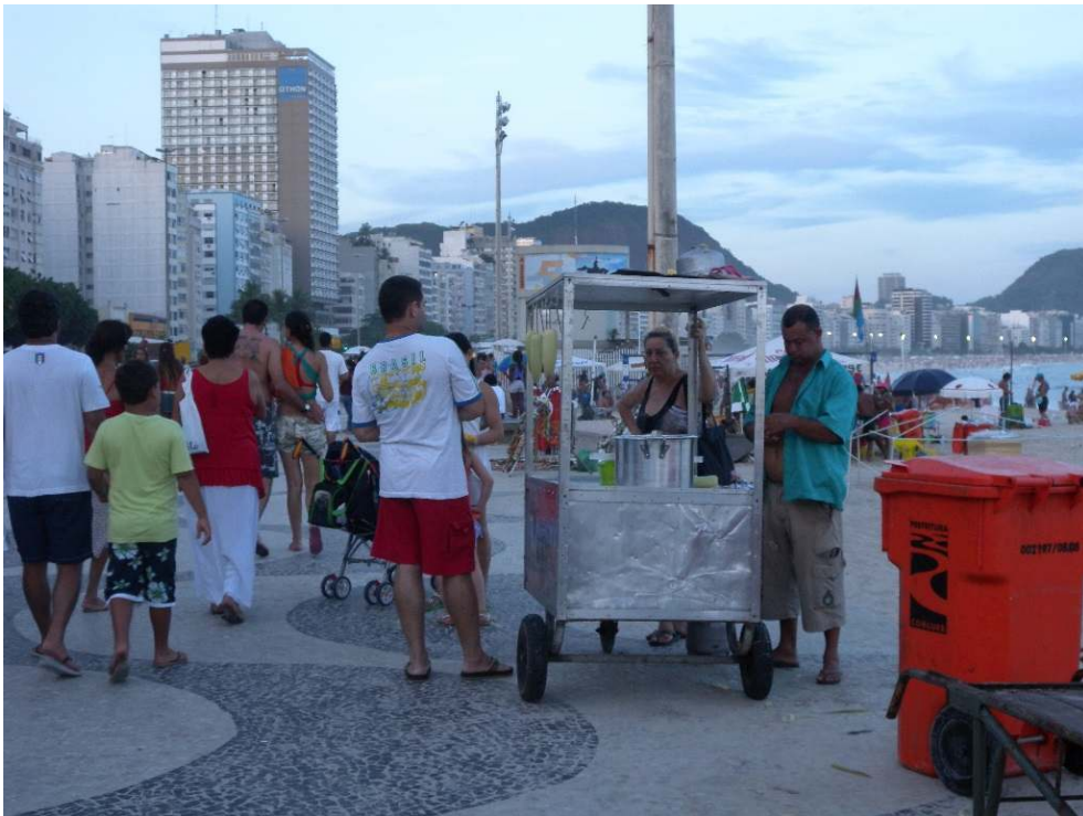
FIGURA 7. Vendedor de milho no Posto 5, morador do Pavão.