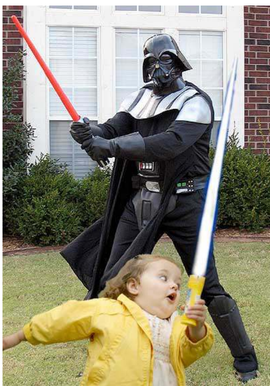
Figura 5: Exemplo de manipulação digital