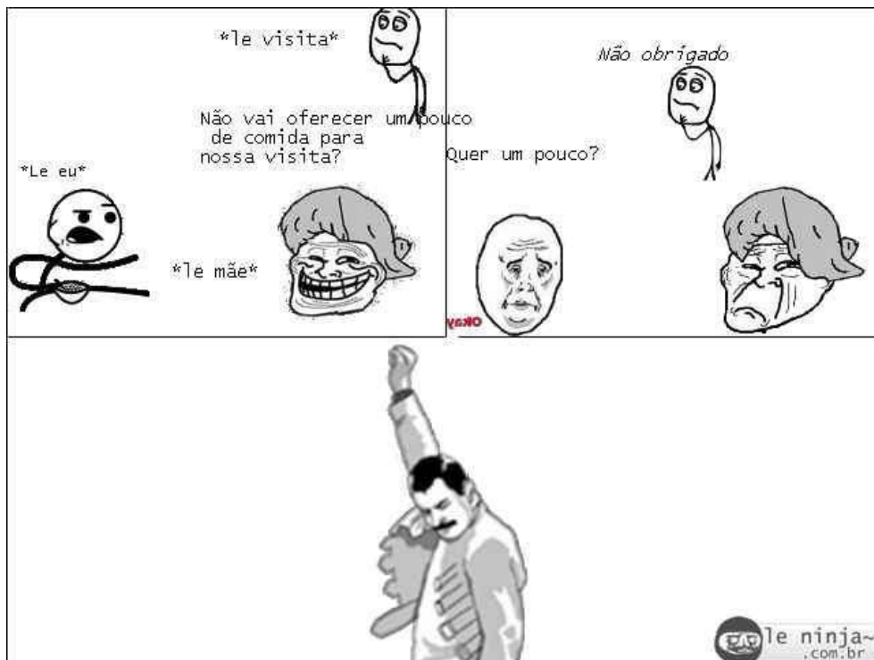
Figura 7: Conteúdo meme produzido pelo blog leninja.com.br