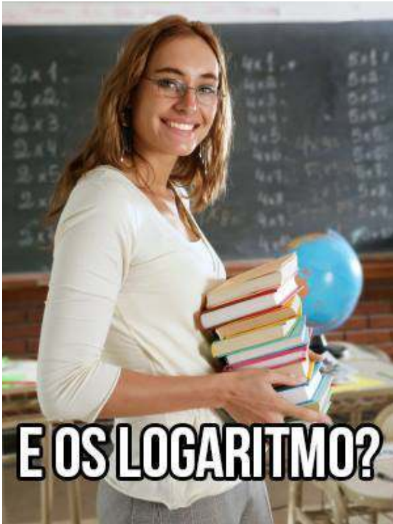
Figura 9: Meme criado pela página “site dos menes” no Facebook