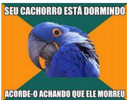
Figura 3: Arara Paranoica