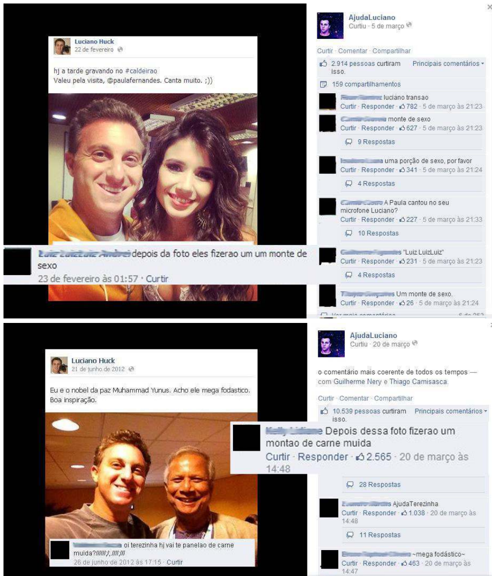
Figura 8: Imagem do conteúdo produzido pela página "Ajuda Luciano" no Facebook