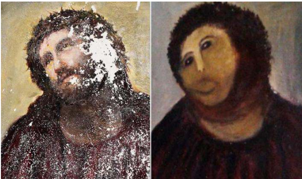
Figura 11: Ecco Homo original ao lado da restauração feita por Cecília Giménez