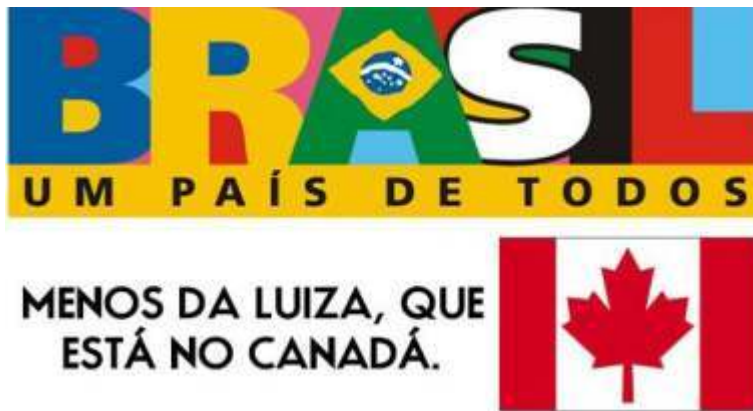
Figura 1: Exemplo de montagem viral