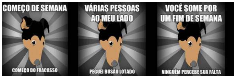
Figura 4: Cão da depressão