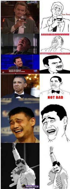
Figura 6: Memificação