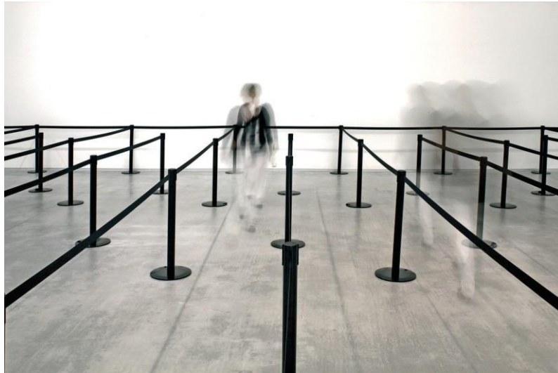
Figura 4: Eva Grubinger, Crowd. Installation view Berlinische Galerie / Museum of Modern Art, Berlin (2007).

“Grubinger nos encoraja a pensar sobre formas de coerção, empregadas especialmente por instituições e corporações, que agrupam e dirigem pessoas e, no limite, as colocam sob escrutínio e controle, muitas vezes sem seu consentimento direto, mas sempre com participação absoluta” (De la Torre, Eric e Kealy, 2014: 41).