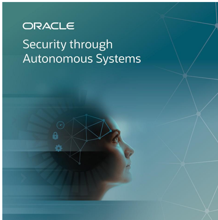
Figura 3: Poster usado na parede de fundo do stand da Oracle no Swiss Cybersecurity Days (Freiburgo 12-13 2020).