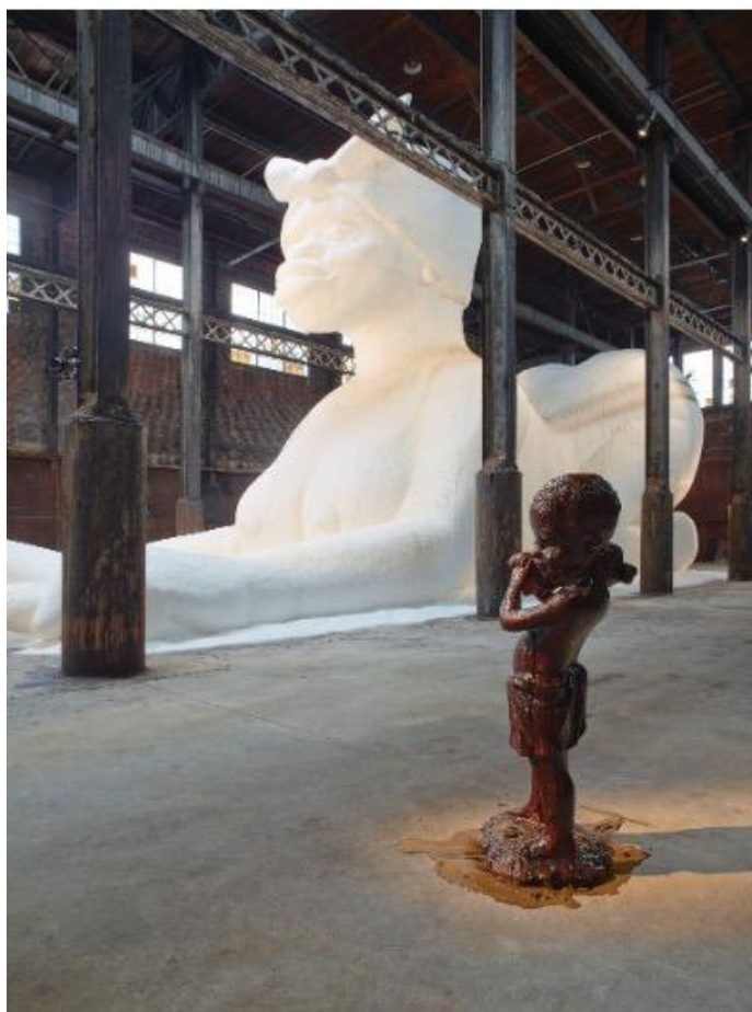
Figura 1: Kara Walker, A Subtlety, ou the Marvelous Sugar Baby , uma homenagem às artesãs não pagas e sobrecarregadas de trabalho que refinaram nosso doce paladar desde os canaviais às Cozinhas do Novo Mundo. Instalação na Domino Sugar Refinery, Brooklyn (2014).