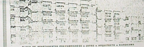
BLOCO DE APARTAMENTOS PREFABRICADOS • JAPÃO • ARQUITECTO • KUROKAWA