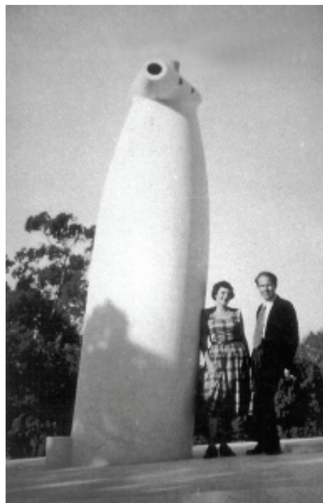
O casal Guedes