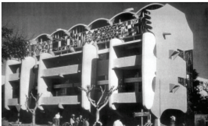
Edifício O leão que ri

Foram mantidas a grafia e a gramática do texto original, em português de Portugal.