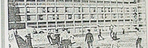
SECTOR DE PARK HILL • SHEFFIELD • INGLATERRA • 350 FOGOS • 400 HABITANTES • ARQUITECTO: LYNN, SMITH, SMITH, SUGGARD