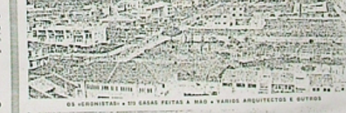
OS «CRISTISTAS» • 200 CASAS FEITAS À MÃO • VÁRIOS ARQUITECTOS E OUTROS