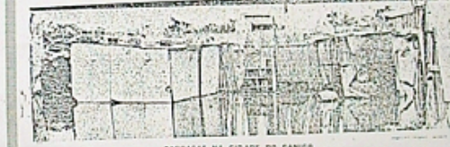
BARRAGENS NA CIDADE DO CANIÇO