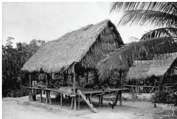
Figura 2: Modelo de habitação indígena, índios kaxinawas do Purus