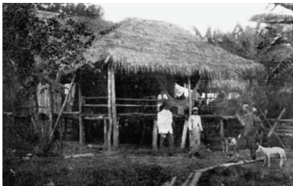
Figura 1: Modelo de habitação do seringueiro – século 19

Aqui, avista-se a casa indígena, com parâmetros similares àqueles da casa do seringueiro: aberta, coberta de palha, assoalho alto, bem ventilada, em uma perfeita integração com a natureza.