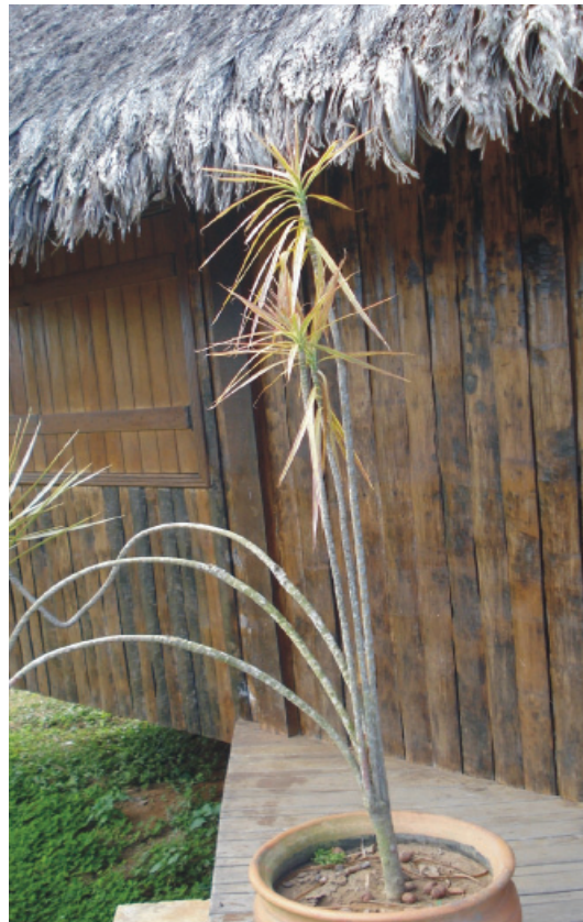
Figura 5: Parede de paxiúba e cobertura de palha

b) Os materiais: as paredes eram construídas em torno de 3,00 m de altura, com paxiúba, no sentido vertical e assoalho também de paxiúba, suspenso do chão. A cobertura de duas águas e inclinação a aproximadamente 45° com palhas da palmeira do ouricuri, sobre estruturas de madeiras roliças, encaixadas e amarradas;