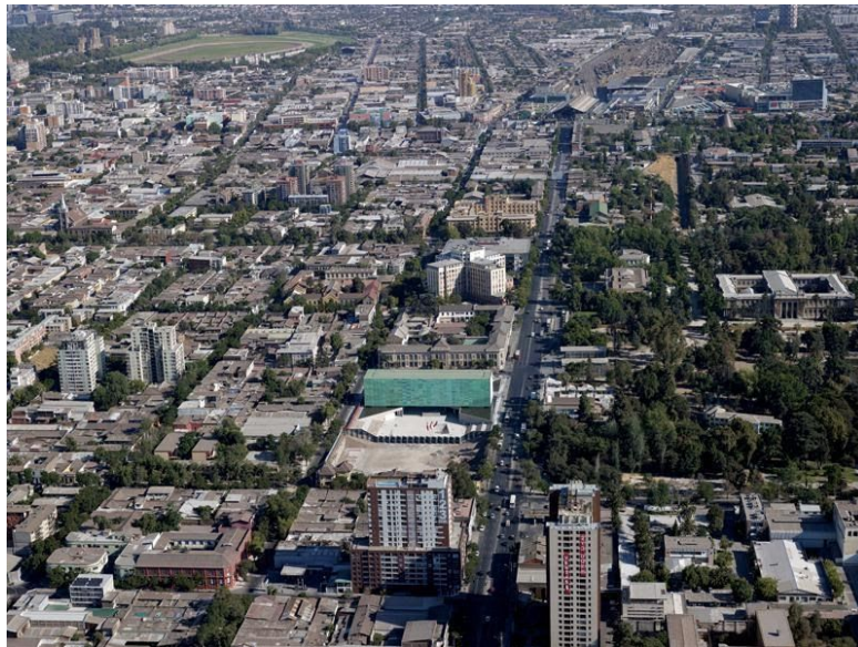
Imagem 4 - Imagem aérea do Museu da Memória e dos Direitos Humanos em Santiago, Chile.