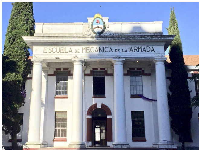
Imagem 1 - Fachada da ESMA

Durante a ditadura, que vigorou entre 1976 e 1983, estima-se que cerca de cinco mil pessoas desapareceram em suas dependências e ao menos 34 recém-nascidos foram subtraídos da maternidade clandestina que funcionava no local. A preservação do complexo de ruas e edifícios, de 17 hectares, situado na Av. del Libertador , endereço movimentado na zona norte da capital Buenos Aires, deu ensejo e impulsionou a “megacausa ESMA”, na qual foram condenados, ao todo, 51 agentes estatais por tortura, genocídio e outros crimes contra os direitos humanos (ARGENTINA, 2015).