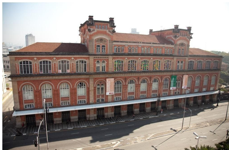
Imagem 2 - Fachada do Memorial da Resistência