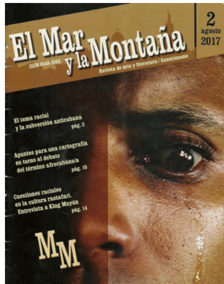
Figura 1- Potada de la revista