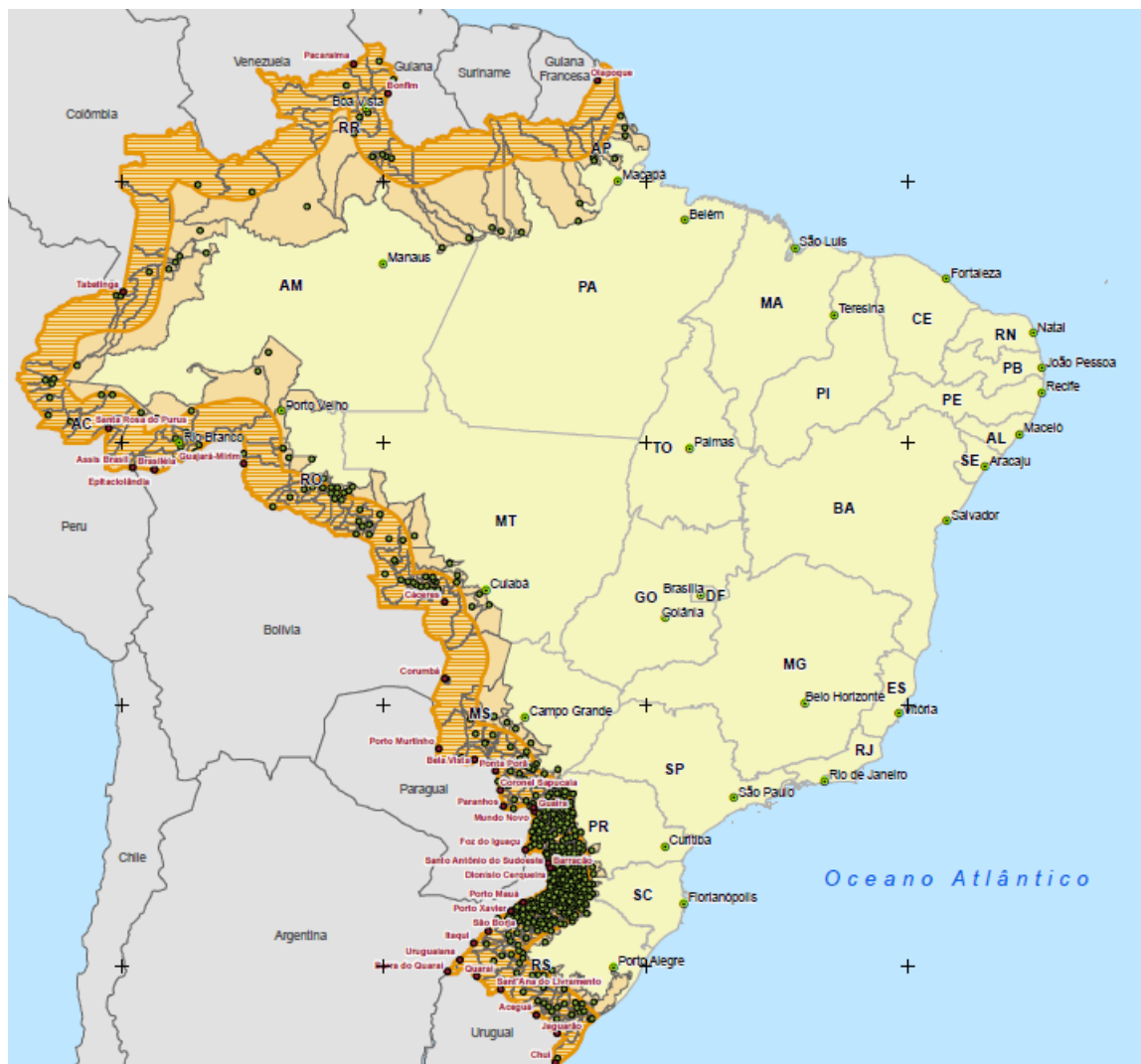
Figura 1: Municípios da Faixa de Fronteira (2022)

contexto de aproximação entre países sul-americanos num momento em que governos progressistas estavam em curso em diversos países da região. Segundo eles, o PDFF “é o principal estudo já realizado sobre a faixa de fronteira do Brasil, abrangendo dados referentes à economia, demografia, cultura, geografia e à realidade social de uma área que corresponde a 27% do território nacional” (CARNEIRO FILHO; CAMARA, 2019, s./p.) (ver Mapa 1).