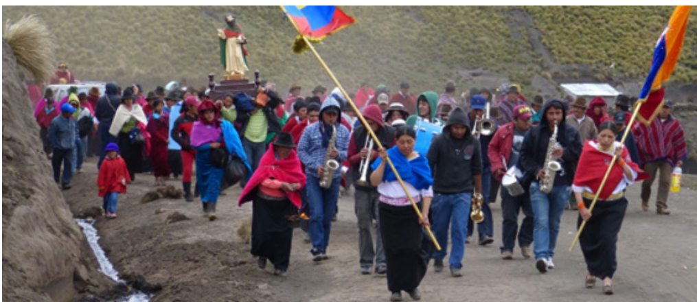
Figura 3 | Llegada de la comitiva de San Pablo a la comunidad de Guantug.

A un lado del centro de la comunidad se ha improvisado una modesta plaza rectangular con empalizadas de madera y unas gradas excavadas en una loma con aforo suficiente para los presentes. El día anterior, los jóvenes subieron a las partes más altas del páramo a atrapar a los toros. Son cuatro ejemplares vástagos de los de raza que antaño subió tayta amito 13 y que, tras la reversión de la hacienda a los huasipungueros, quedaron recluidos al pie de las cumbres tutelares, en los pajonales más remontados. Cada año son trasladados a la plaza y, en un tono jocoso, toreados por los muchachos entre el viento y el polvo. Mientras tanto, los puestos de bebidas expenden gaseosas, cervezas y tragos destilados de caña y las escenas de personas achispadas deambulando entre la gente empiezan a hacerse frecuentes en el atardecer de ese día de yawar fiesta . La tarde eclipsa, las camionetas con afuereños emprenden el regreso, la banda acalla sus instrumentos y como a la media noche no queda un alma sobria a la intemperie en Guantug; sólo los ebrios, mayoritariamente hombres, resisten el embate del frío del páramo que envuelve el poblado.