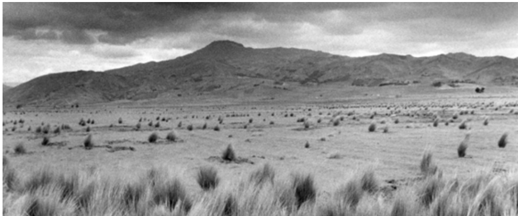
Figura 5 | Panorámica de las llanuras sedientas de San Carlos, objeto del litigio por el acceso al agua.

sas cambiaron en los Andes con el fin del gamonalismo, por supuesto: se activaron las espoletas de la movilidad social, incrementándose la diferenciación social de las comunidades, aumentaron exponencialmente los flujos migratorios a las ciudades y se articuló una élite de intelectuales étnicos, entre otras. Lo cual no está reñido con procesos de reconfiguración de lo identitario que muy bien podrían ser calificados como de etnogénesis. Me estoy refiriendo, por ejemplo, a las maneras de “estar como indígenas” de las actuales dirigencias étnicas, formadas lejos de la lucha por la tierra y articuladoras de discursos que transitan hacia nuevas maneras de entender la identidad, la subalternidad y su encaje con (y en) la modernidad. Pienso también, y sobre todo, en las poblaciones de barrios nuevos engordados por los intensos flujos migratorios que han ido despoblando el medio rural andino y estableciéndose en un hinterland urbano, en el sentido cultural de urbano, es decir, con acceso al consumo de todo tipo de artefactos culturales que circulan por las redes, se hibridan con elementos procedentes de otros contextos simbólicos y estéticos y dan como resultado nuevos artilugios que se interiorizan, a su vez, como propios e incluso, por qué no, como ancestrales, en una suerte de autoctonía global que recorre esas redes, se incrusta en los imaginarios y cristaliza en formas-otras de entender y vivir la modernidad. Pero eso, como el lector imaginará, es materia de otro ensayo.