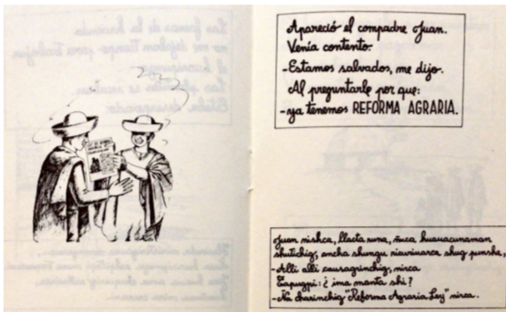
Figura 2 | Ilustración de Historia de un huasipunguero , cartilla bilingüe editada para explicar a la población precarista las ventajas de la reforma agraria de 1964. Fue una iniciativa del Instituto Ecuatoriano de Reforma Agraria y Colonización (IERAC) impresa por Misión Andina, sin paginar.

Desde el punto de vista del Estado y sus tecnócratas, la reforma agraria fue concebida como una medida indispensable para erradicar el gamonalismo y superar el “atraso” y “subdesarrollo” de las masas campesinas sometidas al albur de un sistema “tradicional” y “feudal” de dominación que lastraba el desarrollo de la