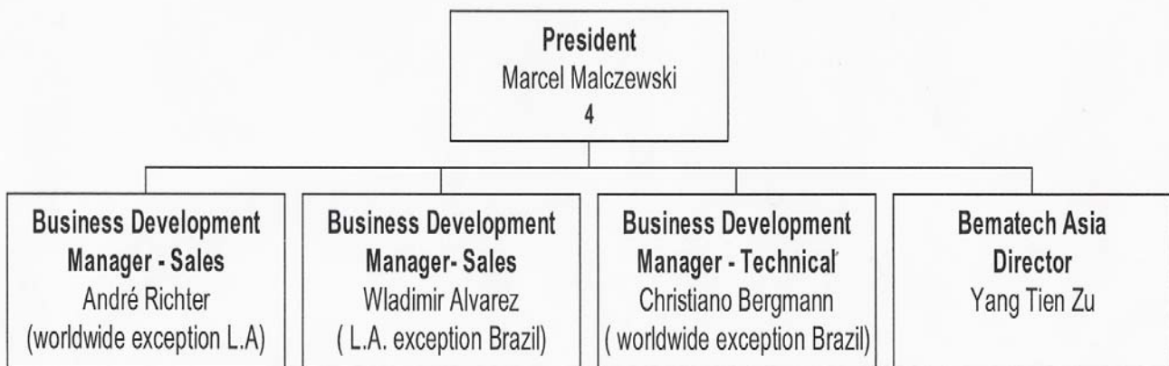
Figura 2 - Organograma Bematech Internacional Corporation