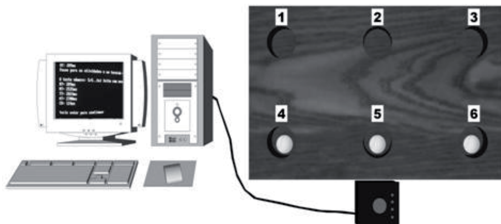
FIGURA 1 - Aparelho utilizado no experimento.

A tarefa constituiu no transporte de bolas de tênis (posicionamento manual) em sequenciamento e tempo alvo pré-determinados utilizando a mão não preferencial (como todos os voluntários se autodeclararam destros, foi utilizada a mão esquerda). A tarefa envolveu precisão espacial (acertar a sequência) assim como precisão temporal (execução no tempo estabelecido).