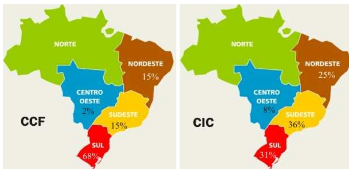
Figura 2 - Distribuição Geográfica dos autores nos Congressos UFSC

A Figura 1 mostra que as regiões Sudeste e Nordeste, respectivamente, apresentam o maior número de autores participantes nos Congressos USP. Como era de se esperar, o Estado São Paulo, sede do evento, apresentou o maior número de autores nos dois congressos. Cabe destacar, também, a região Centro-Oeste, na qual o Distrito Federal teve o maior número de autores participantes no CCC-USP. Ressalta-se que, no CIC-USP, não houve a participação de autores da região Centro-Oeste, o que era esperado, já que nessa região insere-se a UNB.