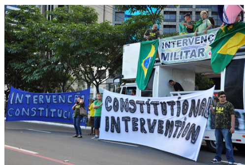
Imagem 2. Pedido de “intervenção constitucional” (Vitória, agosto de 2015).