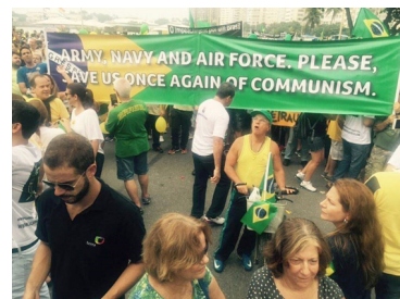
Imagem 3. Cartaz, em inglês, pedindo que Forças Armadas salvem de novo o Brasil do comunismo.