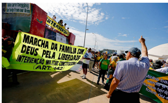
Imagem 1. Pedido de intervenção com base no art. 142 da Constituição (Brasília, abril de 2015).