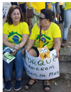
Imagem 5. Cartaz perguntando por que “não mataram todos em 1964” (2015). Fonte: As imagens que mais chamaram a atenção dos protestos de domingo. Recuperado de [http://www.pragmatismopolitico.com.br/2015/08/imagens-marcantes-protestos-de-domingo.html]. Consultado [29-12-2015].