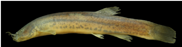
Figura 2. Indivíduo jovem de Trichomycterus brasiliensis (47,0 mm de comprimento corpóreo), apresentando manchas e coloração distintas daquelas registradas nos adultos. Caverna Antônio Osório, município de Presidente Olegário-MG.

Os espécimes de T. brasiliensis foram coletados nas três localidades subterrâneas, dois indivíduos na Lapa Vereda da Palha (41,9 mm comprimento padrão), 12 indivíduos na Gruta da Juruva (61,1 mm comprimento padrão) e 2 indivíduos na Caverna Antônio Osório (33,8 mm comprimento padrão). O espécime coletado de menor tamanho possui 20,3 mm de comprimento corpóreo (Caverna Antônio Osório) e o maior possui 115,6 mm de comprimento corpóreo (Gruta da Juruva). Os filhotes e jovens apresentam um padrão de manchas, pintas e coloração distintas dos adultos, com duas linhas escuras nas laterais, uma mediada e outra inferior próxima a região ventral, juntamente com manchas e pintas espalhadas por todo o corpo e coloração bege claro (Fig. 2). Já os adultos não apresentam nenhuma coloração do tipo linhas nas laterais, apenas manchas e pintas espalhadas pelo corpo, juntamente com uma coloração marrom escura. Tal fase de mudança se inicia quando os indivíduos possuem entre 47-49 mm de comprimento corpóreo.