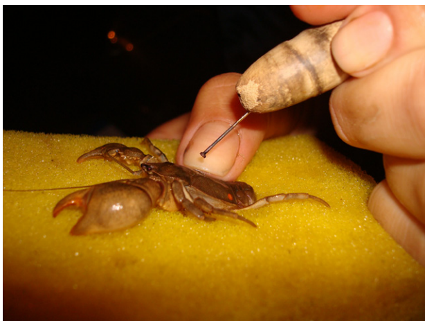
Figura 3. Marcação de exemplar de A. marginata , pelo método de cauterização a quente utilizando agulha aquecida ao rubro.