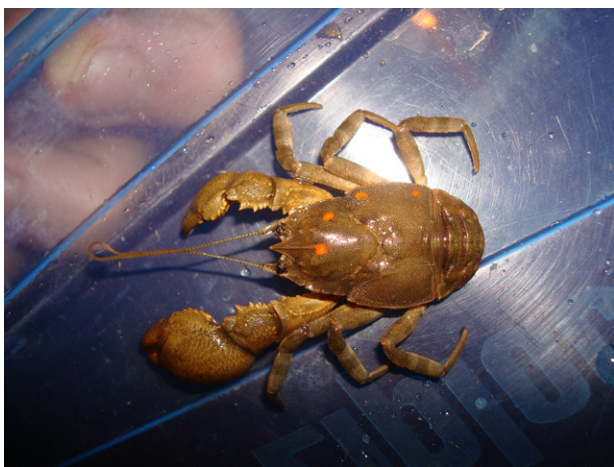
Figura 2. Exemplar de A. marginata com marca individual.

Os indivíduos capturados na Gruta dos Paiva, por quaisquer dos métodos, tiveram sua carapaça marcada, utilizando-se a técnica sugerida por Abrahamsson (1965) e adotada em eglídeos por Moracchioli (1994), no qual são realizadas marcas em pontos diversos por cauterização a quente, de acordo com um código numérico pré-definido. Cada indivíduo recebeu uma marca específica e correspondente a um número (Fig. 2). Para a marcação, foi utilizado um alfinete com sua cabeça aquecida ao rubro (Fig. 3). O reconhecimento dos indivíduos é possível por um longo período de tempo uma vez que as marcas permanecem visíveis mesmo após estes sofrerem de uma a três ecdises sucessivas (Abrahamsson, 1965). Em eglídeos adultos as ecdises ocorrem a cada três ou quatro meses