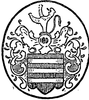
Fig. 1. — Braço da família Böhm.

Quando o Conde de Lippe regressou à Alemanha, em 20 de setembro de 1764, constituia a sua maior ambição a continuidade do desenvolvimento do exército português. Compreensível é, pois, que aspirasse confiar o destino da sua obra a um homem que conhecera como subalterno, discípulo e amigo, e cujas virtudes militares, capacidade bélica e competência lhe fôssem familiares. Sua escôlha recaiu no general ajudante, durante a campanha de 1762, João Henrique Böhm, conhecido em Portugal e no Brasil pelo apelido "de Bohm". Böhm era natural de Bremen, onde nasceu em 20 de junho de 1708. A