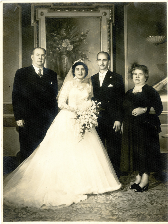
Foto Família Peres, final dos anos 1950, acervo Imagens Fotográficas, MIMo

A composição da plataforma privilegia diferentes conjuntos de imagens, dando origem às abas, quais sejam: Acervos , compostos por Imagens Fotográficas e Indumentária , e Exposições .