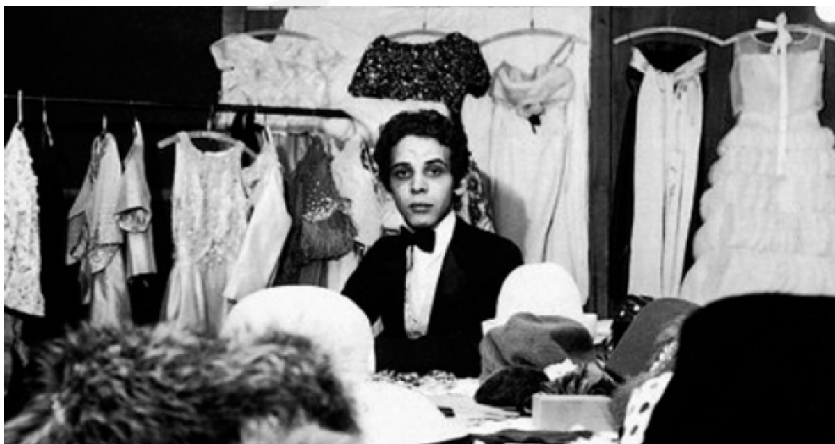
Foto da abertura da exposição Dener Pamplona de Abreu, MIMo

- A interface Exposições abriga a sucessão de mostras em formato de linha do tempo, sobre o trabalho de criadores de moda brasileira, e outras, que relacionam moda e arte, organizadas por curadores, responsáveis pela pesquisa e coordenação dos trabalhos, assessorados por alunos estagiários, tanto na coleta de dados, quanto na tabulação dos mesmos. São elaboradas a partir de temas sugeridos ao museu, encaminhados para aprovação do conselho, discutidos com a curadoria e, posteriormente, montados com o apoio do webdesigner. Deve-se exaltar a transdisciplinaridade que emana desta ação do MIMo, que promove a integração de diferentes setores do museu, funde experiências de maneira interdisciplinar e, ao expor o material produzido, é capaz de gerar informação e conhecimento que redundam em múltiplas interpretações.