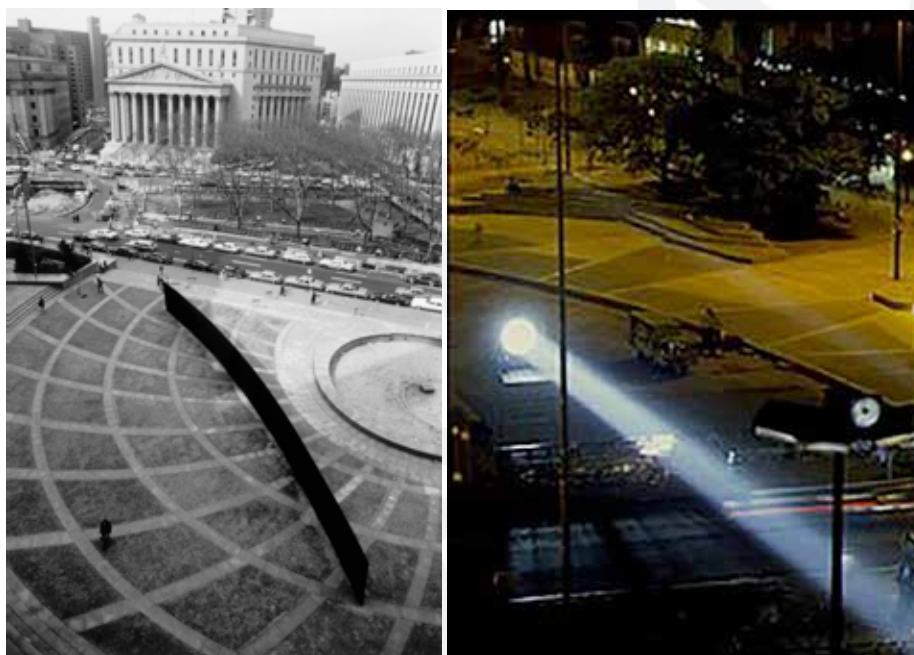
Foto 7 (esq.). Foto da obra Tilted Arc de Richard Serra. © Anne Chauvet Fonte: Cortesia de Richard Serra.