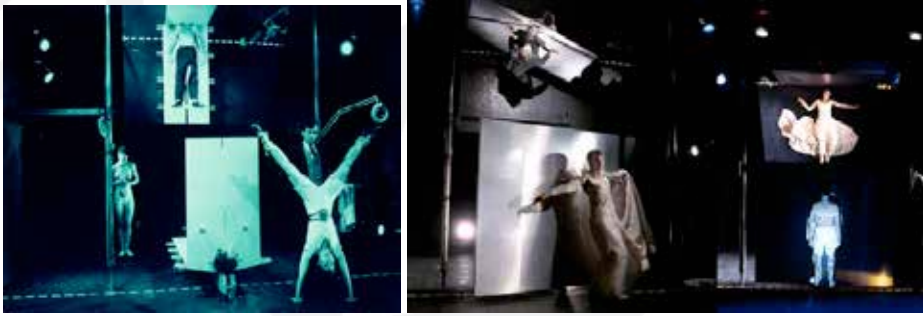
Foto 5 e 6. Obra The Rotary Notary and his hot plate (Delay Glass) .

O grande vidro mantinha os atores em estado de contínua (des)conexão. Esse uso do espelho foi um ato puramente arquitetônico, pois transformou o palco nas modalidades básicas da representação arquitetônica: os movimentos vistos no espelho, à elevação. (Foster, 2015, 115)