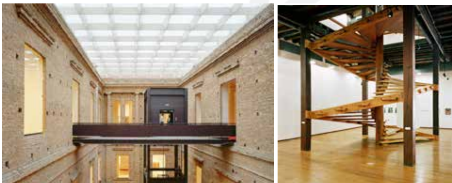
Foto 1 e 2. Foto Pinacoteca (cobertura e passarela) e Solar do Unhão (escada), respectivamente.

Esse espaço de transição vertical desenvolve sua trajetória e sua estrutura ao redor de um pilar central circular. A escada se insere ultrapassando seu caráter funcional de interligar pavimentos, é escultórica e materializa o conceito de intervenção, que se distingue da construção original, adotado pela arquiteta. Inscrita num retângulo de 410 por 470 cm, delimitado por quatro pilares de madeira da estrutura original da edificação, esse elemento arquitetônico é inserido como consequência de um estudo da arquitetura antecedente, o que trouxe uma solução que dialoga com os diversos tempos e interfere sobre o espaço.