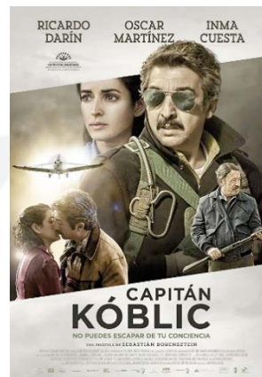
Figura 2 Cartaz de Kóblíc (2016).

se interessando pelo tema para investigação acadêmica, com análises baseadas em farto material documental 17 .