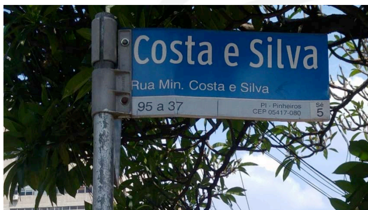
Figura 3 Rua Min. Costa e Silva/SP. 11 de outubro, 2017.

A pressão se deve em grande parte também ao fato de, decorridos vinte e sete anos desde o término oficial da ditadura (1985), sem falar na assinatura da Anistia (1979), o Estado lentamente começou a enfrentar a cicatriz, com política pública para restituir o que seria a verdade dos fatos (2012), ao lado de programa para se erigir monumentos (2004) a Pessoas Imprescindíveis . Na cidade de São Paulo a Comissão Estadual da Verdade e a dos Familiares de Mortos e Desaparecidos Políticos mobilizaram-se para a troca de nomes de atuantes na Ditadura civil-militar. Desde uma extensa lista apenas dois logradouros tiveram seus nomes trocados 24 . Em direção oposta outros tentam manter os rastros, como se observa em informes, reiterando campos em conflito. Idas e vindas são constatadas em vários países, como noticiou a imprensa estadunidense, uma escola com nome de dirigente da Ku Klux Klan , a bradar por racismo, foi trocado, ante a pressão de moradores.